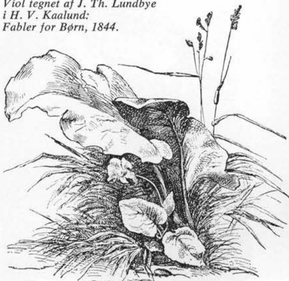
Viol tegnet af J. Th. Lundbye i H. V. Kaalund: Fabler for Børn, 1844.

Hvad var det, den dreng dér fandt? · Se, dér går han. – Er det sandt? · Rigtige violer? – Lugt! · Alle samles. Næ, hvor smukt! · Stille