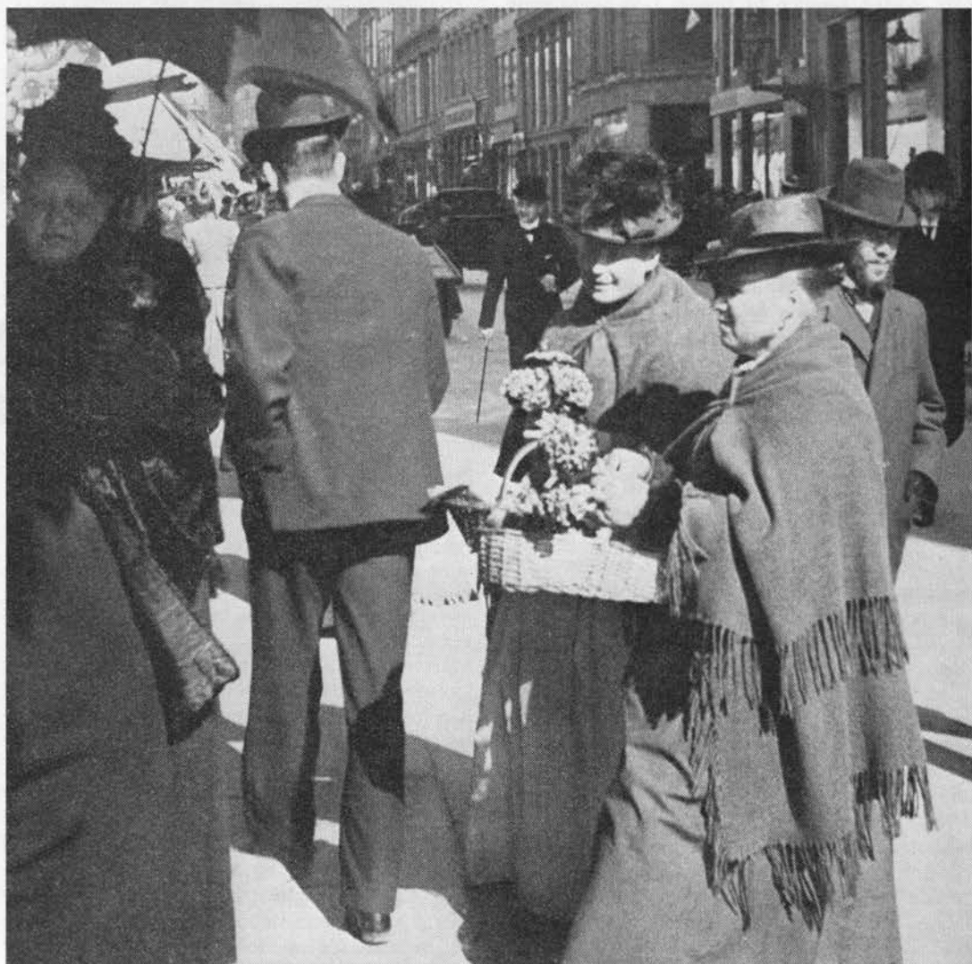
Violsælgere på Strøget, omkring år 1900.

køj) og sorte blomster (martsviol), men skelner ikke mellem deres lægekræfter (1):