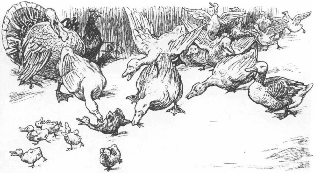
Tegning af Hans Tegner til H. C. Andersens eventyr »Den grimme ælling«. Verdensudgaven, 1930.