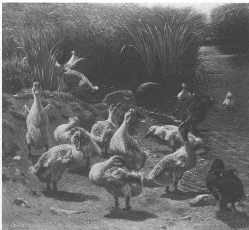
»Ællinger ved dammen«. Maleri af S. Simonsen, 1902.

Han er så brunstig som en andrik (8), så fuld som en ælling (Koldingegnen; 9), nikke med hovedet som nogen andrik (Sønderjylland; 10), være bét som en ælling på den anden side af åen (Bornholm;