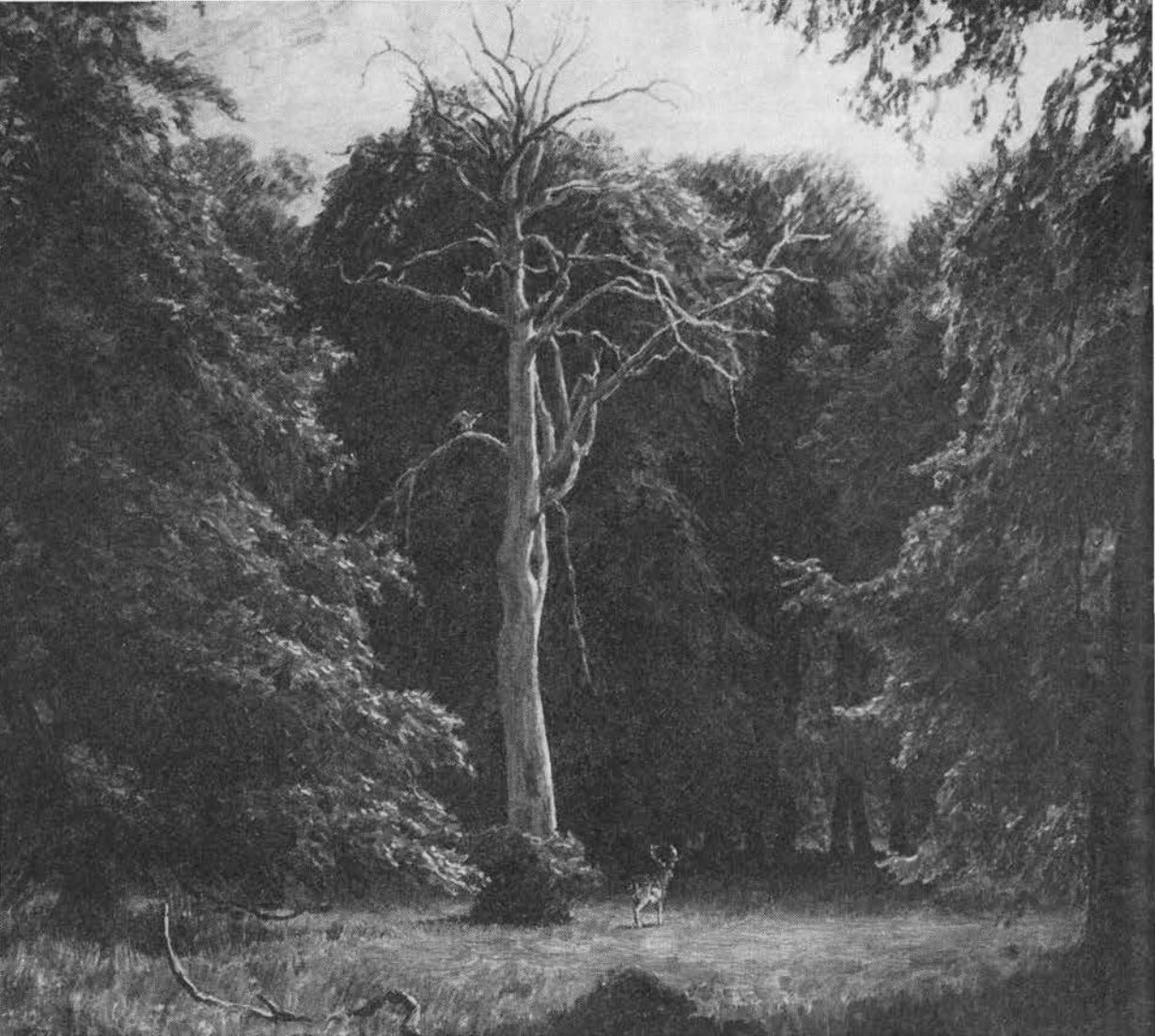
»Den døde ask«. Maleri af Niels Skovgaard, 1927.

vinteren – så er veddet mindre udsat for angreb af orm (1806; 2), sml. s. 157. Fældet og kløvet i marts og tørret i vårlæsten er det bedst og stærkest til husredskaber (1780; 3). Til plejlagler skal fældes i månens sidste kvarter og nymåne, ellers bliver marvstrålerne for åbne og træet sprækker (SFyn; 4).