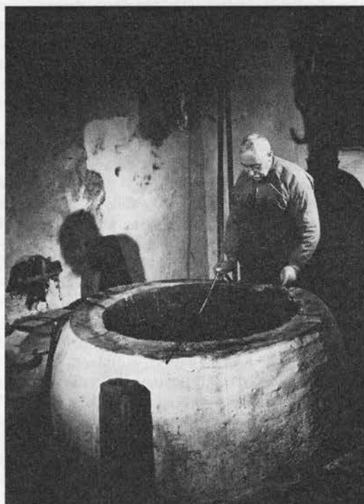
Farver ved sit kar. Dansk Folkemuseum, Brede.

tilberedes på apoteker og hjælper mod hoste og svindrot.