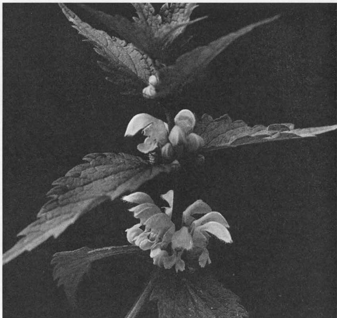
Døvnælde. (EH). Overfor: Almindelig hjertespad. Flora Danica, 1761–1883.

de knuste blade til at drøje mel med (1941; 12). Børn suger nektar af blomsterne (13), sml. navne ovenfor.