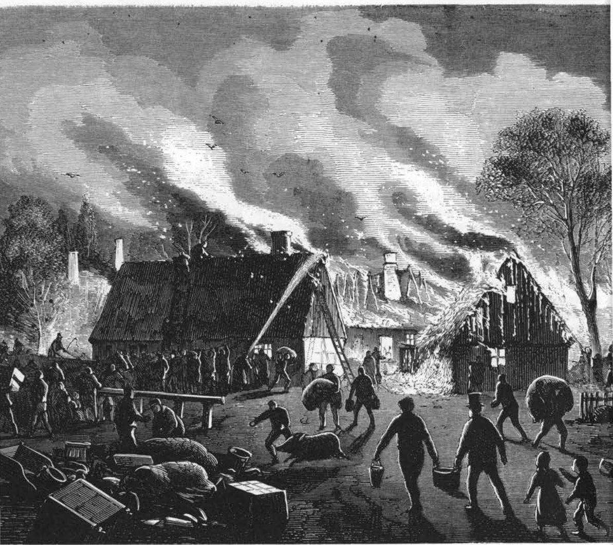
I 1865 udbrød brand i et hus i landsbyen Valby. Ilden sprang videre fra stråtag til stråtag, og snart var 35 huse, 4 gårde og kroen nedbrændt til grunden. Sådanne hændelser gav næring til påstanden om, at eghjorten fløj med gløder mellem kindbakkerne for at lade dem falde ned i stråtagene. Træsnit i Illustreret Tidende 30-7-1865.

spektakel fyrens maskineri laver, den summer og rasler som en gammel flyvemaskine, og drejer den brat af og flyver lige på én dukker man uvilkaarligt hovedet for ikke at blive kørt over« Achton Friis på Æbelø o. 1925 (13).