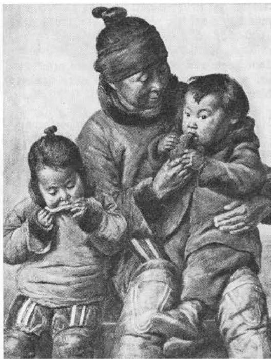
Spisende grønlandere. Maleri af C. Deichmann.

Hanekam o. 1700, som crista galli måske nævnt allerede af Saxo Grammaticus o. 1200; fistelurt o. 1700, 1802, fra tysk; troldmand 1793–1821 er konstrueret, kærskræde MJylland 1795, se skjaller s. 62, iglegræs 1820, sml. soldug bd. 2; o. 1870 og flg.: herremand og hofmand eller -mænd SVJylland sigter til den røde, knejsende blomsterstand, jf. kattehale Ringkøbingegnen. Ormekål Vardeegnen, orm er her slange, snog;