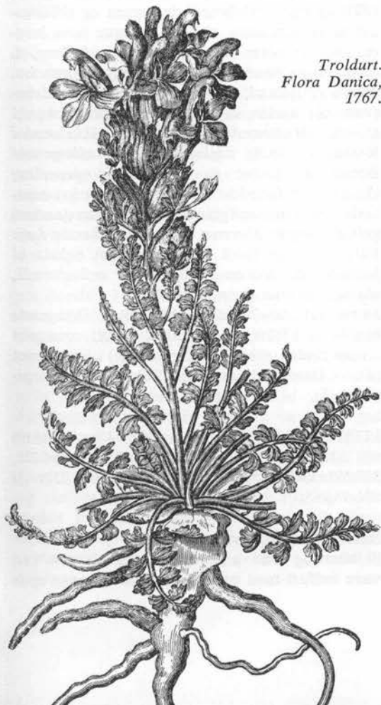
Troldurt. Flora Danica, 1767.

hølékarl Uldumegnen (o. 1895), planten slog hårdt mod leen, når engræsset blev mejet, sml. katteskæg bd. 1; sort rytter Bylderup Sønderjylland, den tørre plante er sort, måske har børn leget med blomsterne som forestillende hest og/eller rytter, sml. lærkespore bd. 2 med lignende blomster; kopatte VJylland, sugepatte ved Silkeborg og tudsepatte Salling, se torskemund s. 60; møurt Herningegnen, uvist hvorfor; rød eller gul skræde (= skjaller, s. 62) Himmerland, Thy. (1). Færøerne: órøkja o. 1780ff (1821 ovrøkia ) = sjusket, skødesløs ♂: om mark, den trives på; lúsagras 1908ff (2). – Grønland (Smith-Sund): igutsarssuit neqigssanguit 'humlebiernes føde' (3).