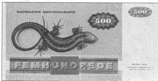
500 kr. seddel med firben udsendt 1974.

for hudpletter og fremmede hårvæksten (14). Havde katten fanget et firben skulle dens mund og poter vaskes i nymalket mælk, ellers kunne muse- ne lugte den på lang afstand (NVSjælland; 15).