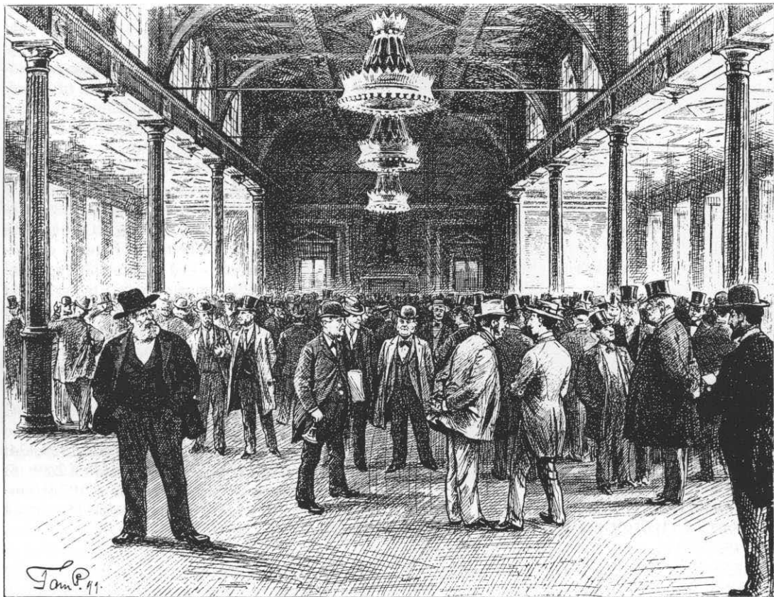
Haj bruges som skældsord til begærlig og hensynsløs person og forekommer som f.eks. »bolighaj« eller »børshaj«. Børsalen i København tegnet af Tom Petersen i Th. Siersted: Danske Billeder for Skole og Hjem, 1897.