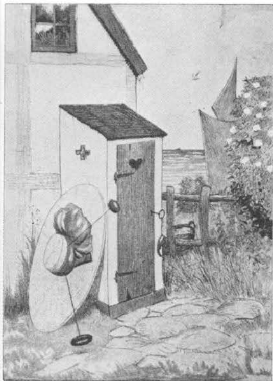
Hummerkloen var et almindeligt brugt nøglevedhæng til »det lille hus«. Tegning af Alfred Schmidt i Klods-Hans, 1910.

En mand, som ferierede på den jyske vestkyst, købte en hummer og gav den til tjenestepigen med en spøgfuld bemærkning om, at hvis den blev rød under kogningen viste det, at pigen lod sig kysse af alle mandfolk. Hun opfattede det som alvor, og »selvfølgelig skete det uundgåelige: hummeren blev rødere og rødere. Gode råd var dyre! Ikke for alt i verden skulle den nederdrægtige hummer kompromittere hende, så hun gav den en omgang skosværte. Resultatet udeblev ikke, hummeren strålede snart som den blankeste kakkelovn. Da hummeren blev serveret vakte den mildest talt rædsel, og så måtte pigen ud med sproget« (3).