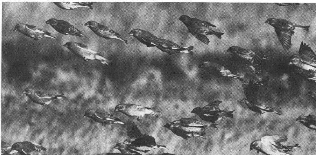
En flok grønirisker i flugt.

(o.1925); (20) 3 59; (21) 169 4,1937,212; (22) 388; (23) 451 214; (24) 753x 26f; (25) 16c 71; (26) a 222f 74; b 222r 36; (27) 753x 31-34; (28) 70c 43-49; (29) 657b 55.