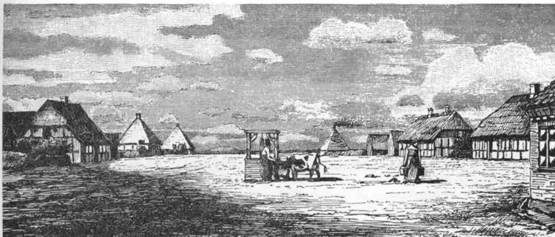
Kolonistby på alheden hvor tyskerne optog kartoffeldyrkningen. Træsnit efter tegning af Hans Smidth, 1887.

Frugten: kartoffelæble 1907ff, ret alm., topæble VJylland; galæble Sønderjylland og hundæble V og ØJylland er nedsættende.