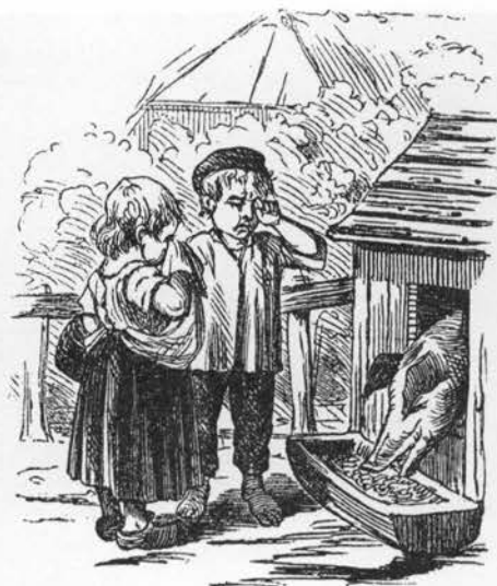
Den dødsdømtes sidste dag. Træsnit fra Wisbechs almanak, 1859.

Som nævnt blev den nye kulturplante betragtet med megen skepsis, man kaldte den spottende