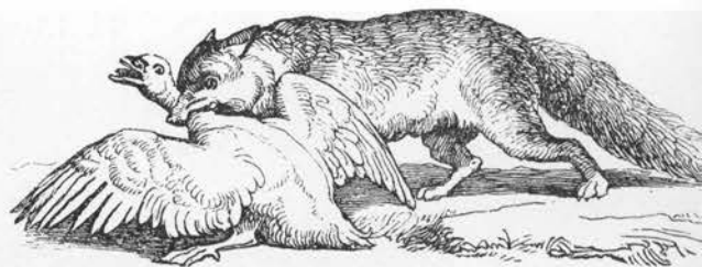
Ræv med fangst fra »Fortællinger og Vers for Børn udgivne af Ingeborg«, København u. å.

Bittersød natskygge gynger blødt på sin bøjede stængel, dens cadmiumgule støvdragere sidder som småbitte julelys i de violette blades stager Achton Friis (6), blomsterne med de udkrængede violette kronblade og hidsige gule støvdragere er ækvivoke, ligesom bærrerne, der i farve løber fra grønt over gult til rødt Christian Elling (7); ranker med ovale bær som granatdupper Ellen Raae (8).