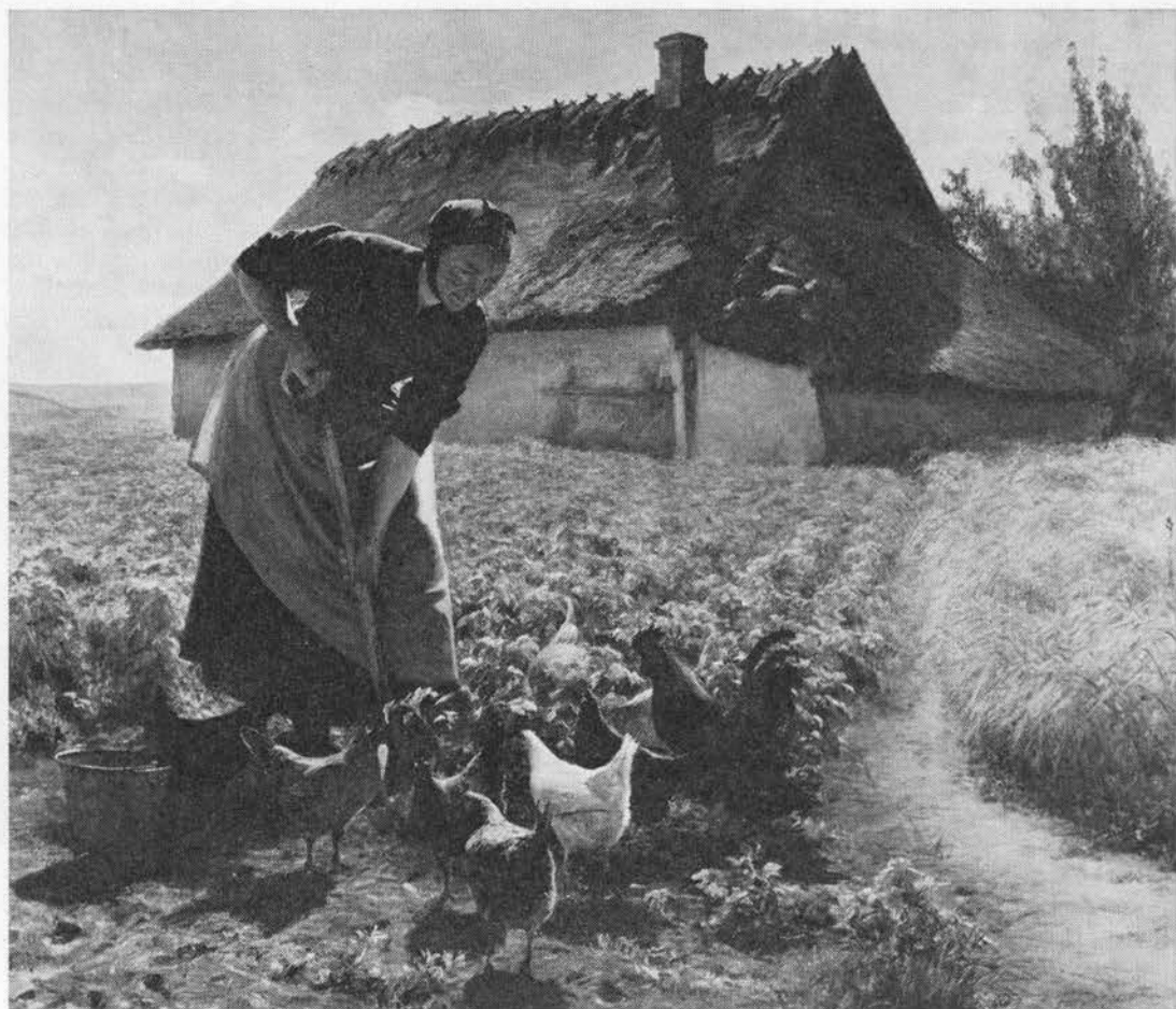
Kartoffelopgravning. Maleri af H. O. Brasen, 1898.

Kogte og lunkne kartofler modvirker diarré hos høns (1793; 28).