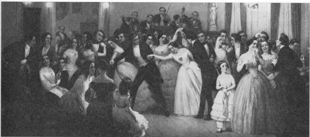
»En Cotillon«. Maleri af Edvard Lehmann, 1853.

I eventyr betinger bjergmand (overnaturligt væsen) sig, at han får toppen af kartoflerne (1). En mand, som havde gravet i Bjerghøj, Funder sogn, fik sine kartofler drejet om, så knoldene