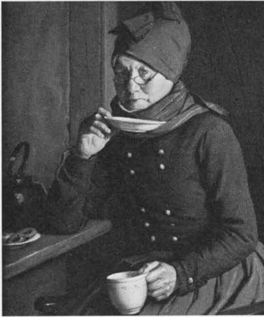
Kommenskringler til kaffen. Fanø-kone malet af Julius Exner, 1899.

(1745); 675 11,1809,322f; (12) 756 241; (13) 92 32, 1949,82 (1833); (14) 858 1799,48; 576 8,1800,258-73 (med dyrkningsanvisn.); 398 1806,286 og 1821,338; 427 1809,41,43; (15) 57c 2,468f; (16) 57 2,176; (17) 189 4,1820,124-29; (18) 559 1823,66; 136d 1837, 253f; 339 126,138; (19) 667 6,1803,332; 57 1,532; 398 1806,286 (koste af stænglerne); 136d 1837,253, 255; 339 37,104f; (20) 667 3,1802,201; 411 225; (21) 318b 1844,109; 546 96f, jf. 936 1,1835,181-84 (Jyll., m. dyrkningsanvisn.); (22) 567 1839,317; 207 1840, 33; (23) 798 1831,216; (24) 941 66; (25) 760 279; (26) 136b 119; (27) 806j 70,77; (28) 661 6,231; (29) 488i 3,295f; 488 3,118; (30) 891b 4,1823,115f; 505 1,1952,69f; (31) 24b 31; (32) 830 efterslet 1890,213; 488f 2,82; (33) 573 2,1873,369; (34) 86 5,1860,97f; (35) 916 3.4,1856,72-74; (36) 512 9,591,601; (37) 939 1880.1,454; 332c 1877,71f; (38) 510 3,933; 183 3,112; (39) 191 2,278f; 44 137ff.