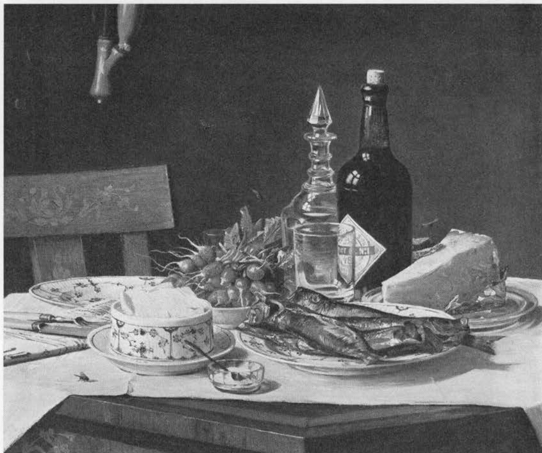
Kommen giver smag til mange slags mad – brød, ost, kål, pølser – og ikke mindst til brændevin. Maleri af O. A. Hermansen med titlen »Et frokostbord«, 1884. Statens Museum for Kunst.

salat (1761; 1), roden spises nogle steder (Danmark?) som pastinak (1800; 2), grøn kommen anvendes tidligt på året som grønkål (1820; 3); unge blade sættes undertides på suppe (o. 1880; 4), man kommer de grønne hakkede blade i kålsuppe og sauce (5), grønkål og hvidkål koges med flæsk og kommenblade (Bornholm o. 1890; 6).