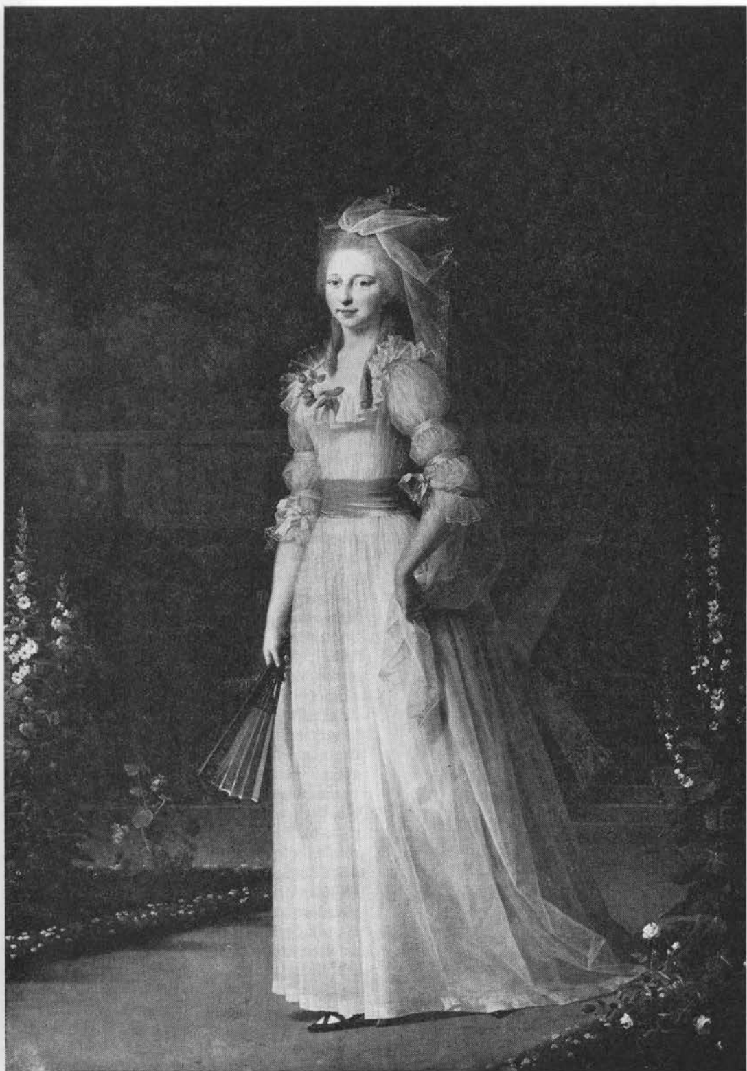
Kongelys flankerer hertuginde Louise Augusta af Augustenborg. Jens Juel, 1787.