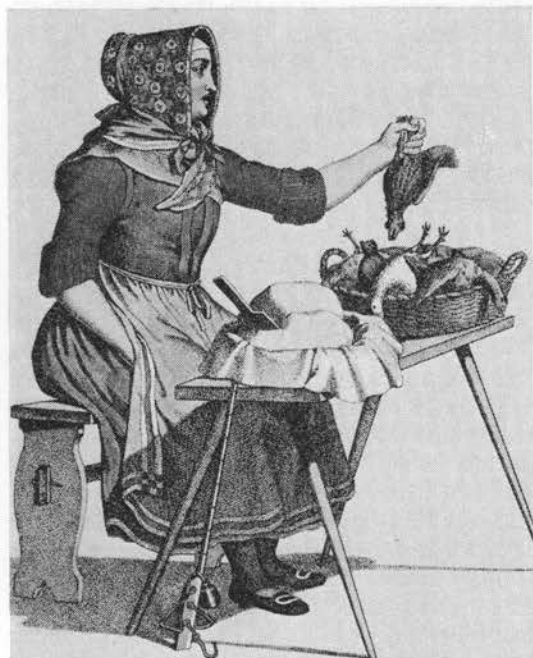
Fjerkræhandlerske fra G. L. Lahde: Københavns Klædedragter. København 1830.

tænding), lunter og lysevæger (o. 1800) (9), blomsterne til at farve gult med (10), og de giver en velsmagende teerstatning (1837; 3).