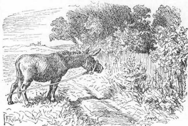
Illustration af Lorenz Frölich til H. C. Andersens eventyr »Hvad tidselen oplevede«.