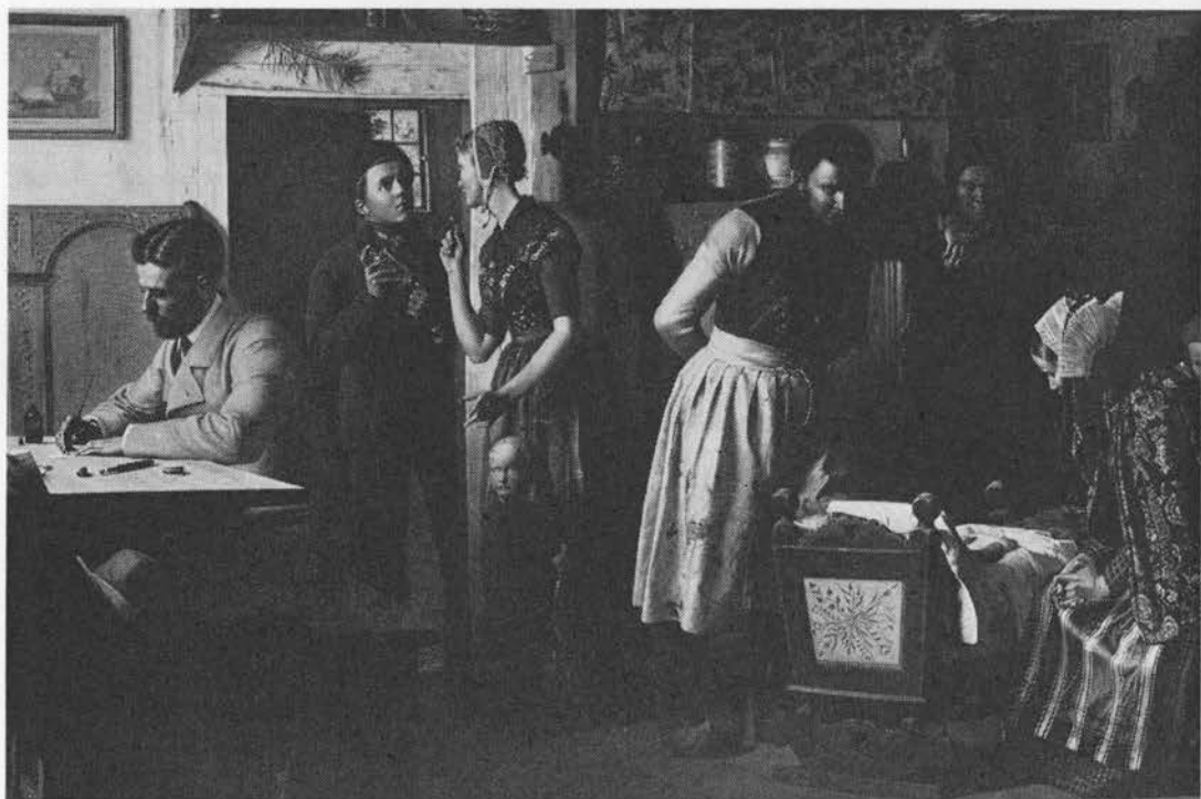
Chr. Dalsgaards maleri »Fiskerens lille barn er sygt« beskriver et almuemiljø, hvor den moderne lægevidenskab har fortrængt ældre tiders folkemedicin.

del, planten anvendes ofte ved fremstilling af mavebitre og likør (16).