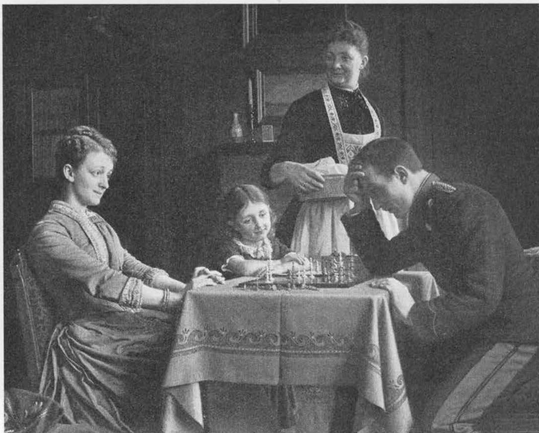
Kristtornens hårde ved var meget anvendeligt til drejerarbejder som f.eks. skakbrikker. Maleri af Fr. Vermehren med titlen »Skakspillere« fra ca. 1880 (udsnit).

lik) andre, bedre og tryggere midler end dette træs bær, »hvorfors da lade sig overtale og ligefrem bedrage« ved at forsøge med dem? (1648; 1).