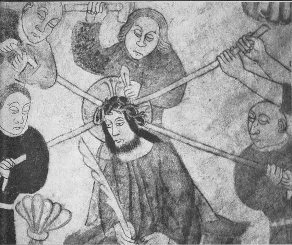
Kristi tornekrone. Kalkmaleri fra ca. 1480 i Gislinge kirke, Holbæk amt. (es).

(7) 739 2,1800,187; 599b 2,572; (8) 355 16, 203 jf. 17,1897,7f; (9) 355 1931,235-38; (10) 697 58; (11) 258 1943,146; (12) 398 1806,225 og 1821,270; (13) 946 15.