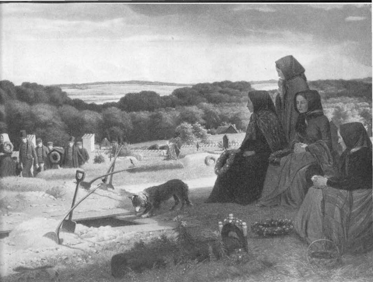
»En ligfærd«. Maleri af J. Sonne, 1832. Kristtorn var almindeligt anvendt i gravkranse.

af kristtorn over hovedet på den hjemvendte svend, mens denne fremsagde sin hilsen til laugget (Horsens 1807; 14).