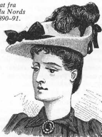
Hvid filthat fra Magasin du Nord's katalog 1890-91.

Blomsterne hænger som små røde og violette