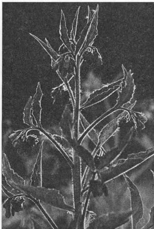
Kulsukker . (N).

Låduert 1596, stor vundurt (=sår-) 1619-1769, vilde druer 1677 vel på grund af blomsterstandens form og rigelige nektar; æseløre 1769, sort-