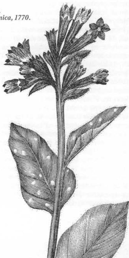
Lungeurt. Flora Danica , 1770.

Lungeurt o. 1450ff (Iwngewrth) jf. det botaniske slægtsnavn af latin pulmo = lunge, oprindeligt til en art lungedannet lav (bd. 1) og overført til denne plante, fordi de plettede blade lignede en syg lever og derfor blev anvendt mod lungelidelser. Plettet rahel 1648, se kulsukker s. 85, lungesoturt 1700-t, lungestykke 1793–1821 konstrueret navn, ræverose Fyn 1800-t er ned-sættende, rød kodrevel Århusegnens o. 1870ff efter blomstens lighed med kodriveren, jf. blå