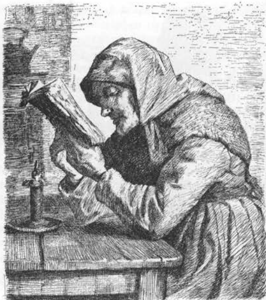
Læsende aftægtskone. Træsnit efter maleri af Anna Ancher.

Øjentrøst o. 1530ff (øffuen trøst, øyetrøst) fra tysk, anvendt mod øjenlidelser (se nedenfor); eufrasia o. 1450–1700-t efter det botaniske slægtsnavn; ledgræs Alborgegnen o. 1820, Jylland 1821, de korte blade giver planten et leddet udseende; hedete Salling o. 1870 efter voksestedet og anvendelsen (1). – Færøerne: eynagras , ey-