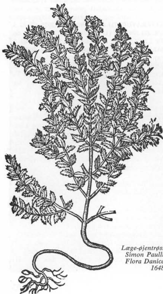
Læge-øjentrøst. Simon Paulli: Flora Danica, 1648.

Den blomstrende plante styrker hjernen, stimulerer vædskernes omløb; saften bruges til badning af øjenlågene eller ryges som tobak for svækket syn, der skyldes overanstrengelse – »individer på 70 år og derover, hvis syn er svækket