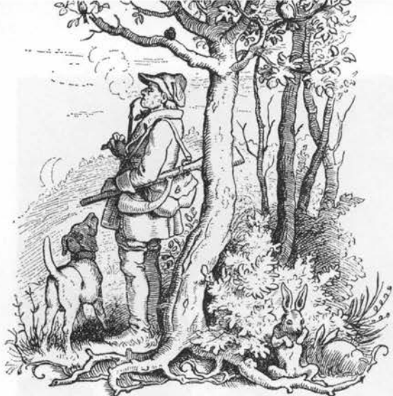
Ærenpris værner bøsse mod forhekselse. Fra »Fortællinger og Vers for Børn udgivne af Ingeborg. København u. å.

salvie, hyldeblomster m.m., de købte aldrig kinesisk te (Sdr. Omme begyndelsen 1800-t:). Bladene af tveskægget ærenpris gav også en behagelig te (9).