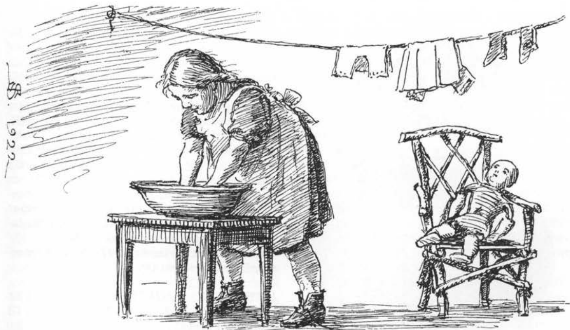
Vaskescene tegnet af Niels Skovgaard, 1922.

vendel værner stuen mod fluer og myg (Mors o. 1900; 11). I gåsestien gnider man med lavendel- og bomolie mod fluer (12).