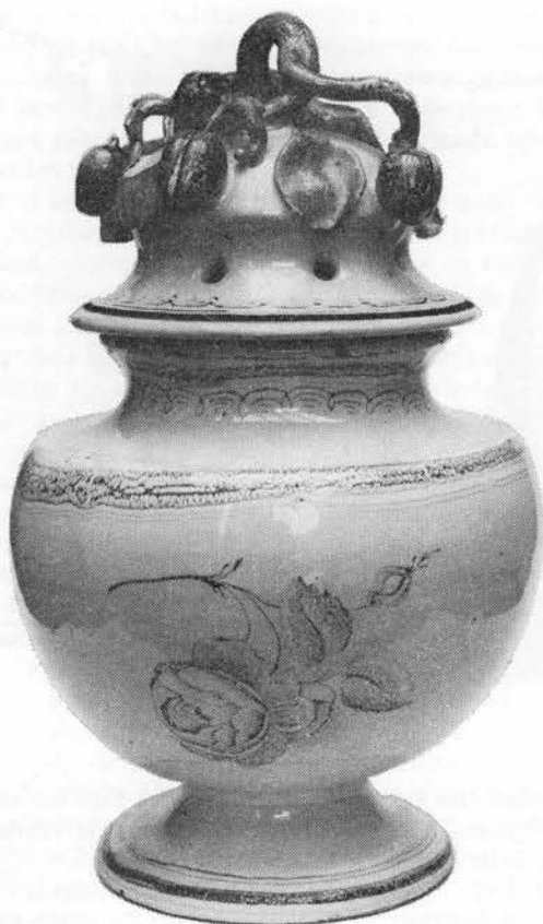
Lavendel indgik som en fast bestanddel i potpourrikrukkens indhold. Dansk Folkemuseum, Brede.

(17) 398 1806,551; 531b 1829,147; 305 25; 128 30; 549 176; 250b 39 (Horns h. o.1820); (18) 358 28f; (19) 182 3.1,1805,83f; 398 1806, 551; (20) 380 nr. 47,1946; (21) 296 52,1935,90; 227 1938,894; 780 24/1 1939; 455 8/7 1939; Schou-brochure 1943.