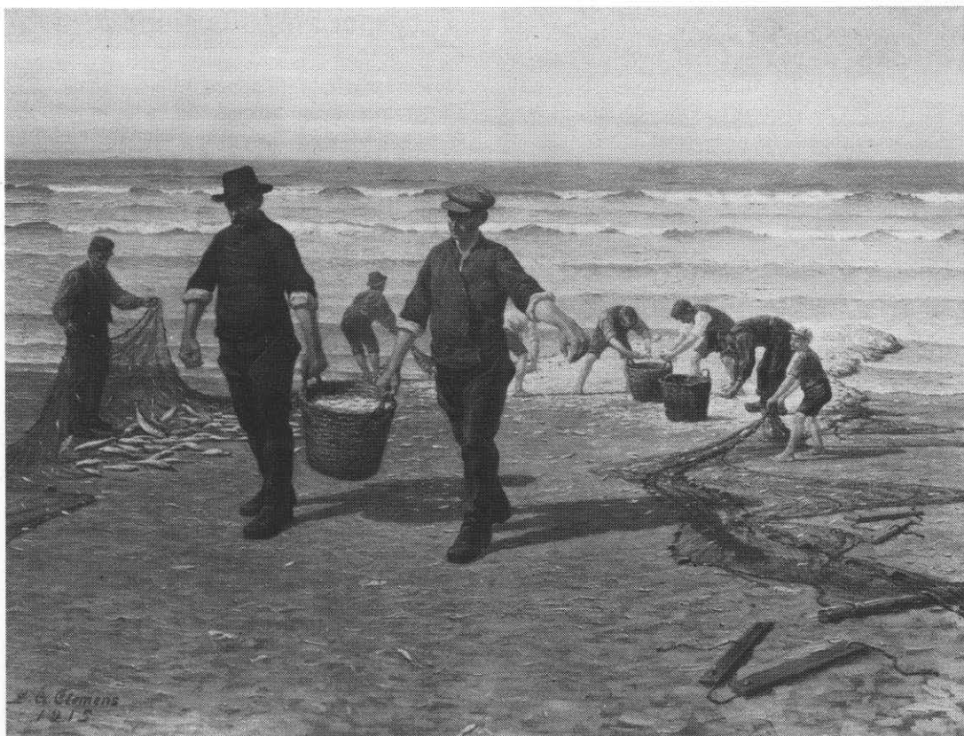
Makrelfiskere bærer fisken i land, mens kvinder og børn er med til at tage fiskene af nettene og fylde dem i de flettede kurve. Maleri af G. A. Clemens, 1915.

slem at falde · blandt en stime af makrel. · Man bli'r nappet, bidt og flænget, · man bli'r revet rent ihjel Holger Drachmann (10).