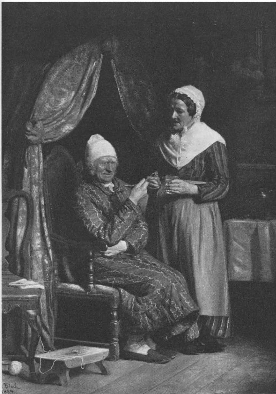
»Bitter medicin«. Maleri af Carl Bloch, 1884.