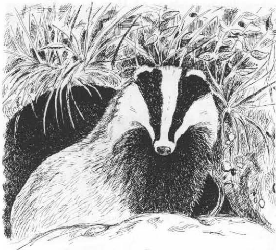
Grævling tegnet af Jeppe Ebdrup i Danske vildtundersøgelser, 1977.

Grævlingen ser fra den spegede rugmark og snøfter · med trynen i jorden og knaser på skarnbassekravlet · og lusker langs diget til mosens forjættende grøfter · og virrer med hovedet og dingler med tapper af savlet Knud Wiinstedt (2); inde bag bakkerne lusker en grævling; · vogt nu, o hyrde, de hvide små lam! · Ser du hans bo, · lad ham i ro, – · han bider lukt gennem strømper og sko Jeppe Aakjær (3).