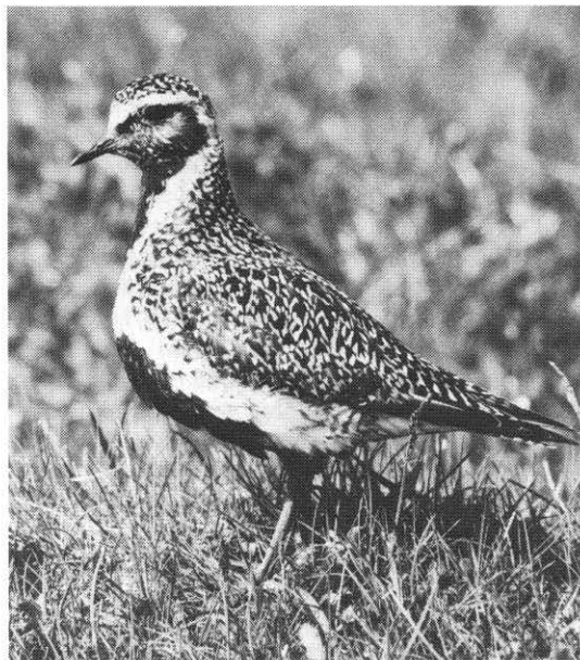
Hjejl på yngleplads.