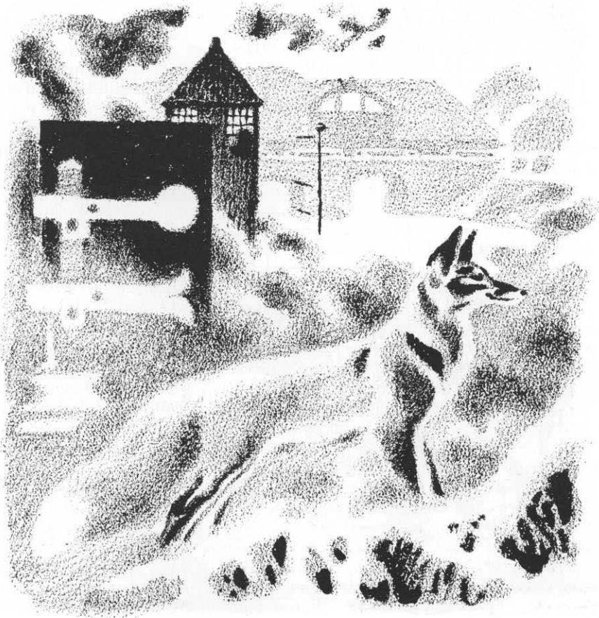
Ræv ved byens udkant. Tegning af Sikker Hansen i Hans Hvass: Sikker Hansen og dyrene, 1956.

42; (12) 464c 197; (13) 212c 3,112; 464c 263; 794 2,136; (14) 561 2,201; 725 634; (15) 903 5.2,1829, 20; 561 2,202; 282 nr. 3002; (15a) 534b 30; 659 25,1081f; (16) 283b 140 sml. 878 184; (17) 283c 214; 212c 3,112; 932 9,42; (18) 777b 139; 279 242; (19) 464c nr. 6995; (20) 561 2,199; 903 5.2,20; 932 9,42; (21) 561 2,202; (22) 434 1,297; (23) 434 1,297; 464c 349; (24) 464c 601 sml. 181 38; (25) 561 2,202; 212c 3,112; (26) 282 nr. 2198; 464c 262; (27) 561 2,199; (28) 561 2,201; 282 2654; 279 242; (29) 572 nr. 2961; (30) 281d (1886); (31) 810 42; (32) 282 nr. 2196; (33) 434 3,648; (34) 459b 84; 212c 3,112; (35) 219 9.2,1798,214; (36) 810 7; (37) 534b 29-35; (38) 653 181; (39) 903; (40) 659 18,130; (41) 283c 211 (Sønderj.); (42) 794 2,26; 932 1955,42; 282 nr. 2205; 534 30; (43) 561 2, 113; 459b 134 (Angel); (44) 66 2,135,158; (45) 837 17,1941,109; (46) 561 74 (1876); (47) 794 2,234; (48) 459b 99; (49) 181 49; (50) 212c 3,112; 932 1944,61; 423; (51) 160 1906/23; 2057; (52) 561 1, 620; (53) 561 2,201; 235 9,1939,202; (54) 387 187; 534b; (55) 282 nr. 2202; (56) 464f tb. 3,70; (57)