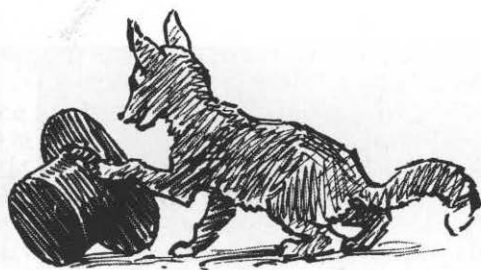
»Rævestreger«. Tegning af Niels Skovgaard til »Børnevers af Ingeborg Simesen«, 1922.

534b 31; (58) 283b 141; 212c 3,115; 464c 48; (59) 464c 263; (60) 434 5,870; 903 5.2,21; (61) 561 2, 202; 212c 3,112; 659 18,130f; 918 228; (62) 283b 137; 212c 3,112 (VSlesv., VJyll.); (63) 212c 3,112; 464c 263; (64) 903 5.2,21; (65) 794 1,191; 534b 30; (66) 459b 28; (67) 561 2,99; (68) 459b 27; (69) 311 1930,134; (70) 464c 263; 212c 3,112; (71) 874h 118,123; (72) 222 98; (73) 160 1906/46:2071; (74) 475 19,1967,102; (75) 160 1906/134:108; 1906/ 23:502; 202c 3,212; 464c 263; (76) 388; (77) 434 5,869; (78) 837 3,1926-27,30; (79) 464c 20; (80) 459b 21 sml. 28; (81) 423; 212 154; (82) 464c 601; (83) 423; (84) 149 3,1895-96,233; (85) 464c 601; (86) 794 1,184,187; (87) 459b 57; 423; (88) 534 40; (89) 232 34; (90) 571 461; 459b 149; (91) 434 5, 870; 903 5.2,21; (92) 434 3,648f; (93) 659 18,131-39; (94) 212c 3,115f; 202c 3,212; (95) 276 2,545; (96) 212c 2,589; 804 1,99; 149 3,232; (96a) 659 18,135; (97) 393 330; (98) 23 138; 659 18,136; (99) 76b 72; (100) 671 25.