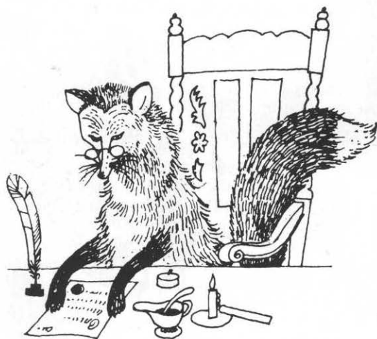
»Brevet til Vejle« er et kendt vrøvlevers, der lyder: