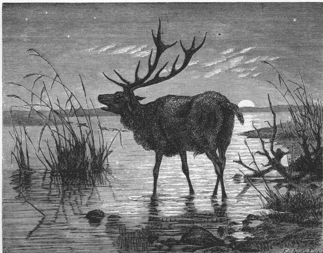
Romantisk træsnit af Th. Philipsen med brølende kronhjort stående i sø ved solnedgangstid. Illustration til Chr. Winther: Billedbog for Store og Smaa, 1871.