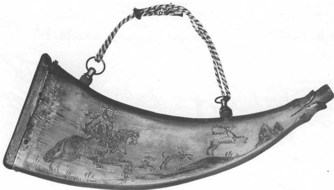
Krudthorn fra Jylland lavet af sammenpresset dyrehorn med udskåret munding og indridsede figurscener. På den viste side er afbildet en jæger til hest med to hunde efter en springende kronhjort.

det af en gud med hjort og ulv. »Vi kan tænke os, at hjorten har været ført i højtidelige optog gennem byderne ved de regelmæssigt tilbagevendende fester ... Efter alt at dømme har hjortedyrkelsen ingensteds i Norden fæstet så dybe rødder som på Sjælland, det fremgår uomstødeligt af oldsagn, stedminder og sejt nedarvet folkeskik« (5).