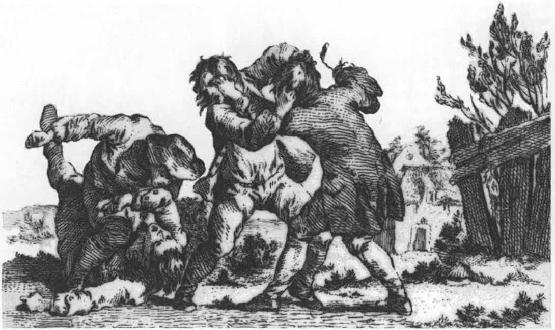
Røllike var et gammelkendt middel til at hele sår og skader efter et raskt slagsmål. Stik af J. J. G. Haas. Kobberstiksamlingen.

og modvirker således mavepine og ophørt vandladning (1856; 6). Nyserøllike anvendes som nysemiddel og mod tandpine (1806; 5).