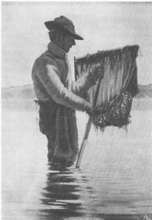
En rejefisker med ketcher. Maleri af Hans Smidth.

1880 (12), rejehoppe Falster, Lolland (16). Stor rælus Mors (13), rælus = tangloppe; blank reje om roskilderejen NVSjælland (14); lille vinterreje: myg (15), tom reje : nordreje SFyn (14); kongerejen er hvidgrå og ikke gennemsigtig, man mente den anførte stimen (19).