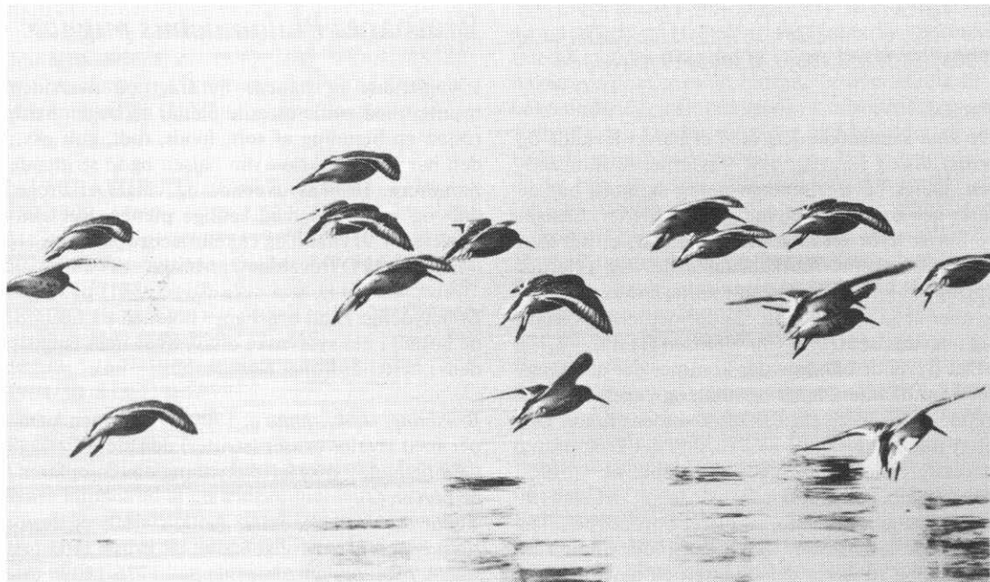
Almindelige ryler i flugt.

Nekselø, Sejerø o. 1890 (19), ridderk Omø (18), tyle Ourø (18a), stolk Nyord (20), pytting ØMøn , Falster, VLolland (18).