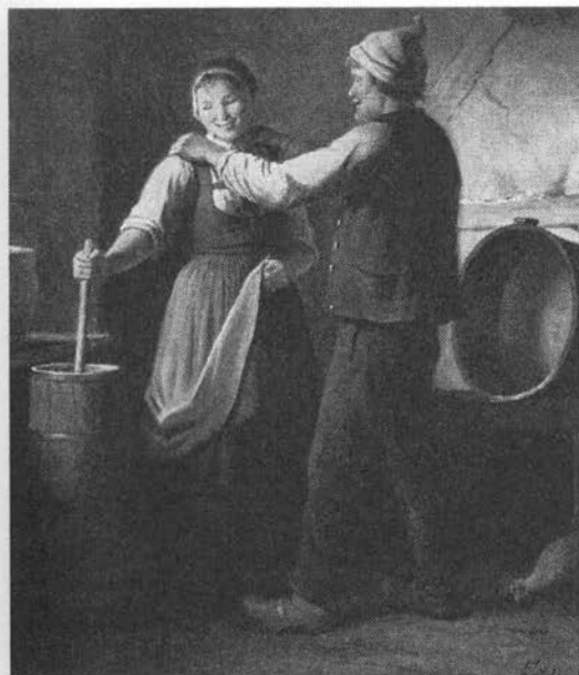
Kærestefolk tog varsler af Sankt Hansurtens vækst. »Et frieri« malet af Julius Exner, 1862.

Viborgegnen, VLolland, troskabsurt Vendsyssel, spåblomst Thy, levekål vestlige Sønderjylland, lykkeblomst Fyn og kysseurt NFyn – alle på grund af plantens anvendelse til orakler, se nedenfor, ligeså måske gildestikker og gyldenslikker Als, til gild = god (kunne varsle noget godt), har imidlertid også været brugt mod »gyldenåre« = hæmoroïder. Brandblom Angel, brandurt Vardeegnen, bladene blev lagt på brandsår; isblomst VSjælland, sml. stenurt s. 34; St. Hanskål Jylland, Fyn, SSjælland, St. Hansblomst Fyn, SSjælland, St. Hansrose SFyn, hønsurt Als omdannet af (St.) Hans urt; St. Olesurt Lolland, måske fordi den kan blomstre Oles dag 29/7; hundeløg Vejleegnen, husløg Fyn og tagplante Haderslevegnen, klippeløg og harekål Bornholm.