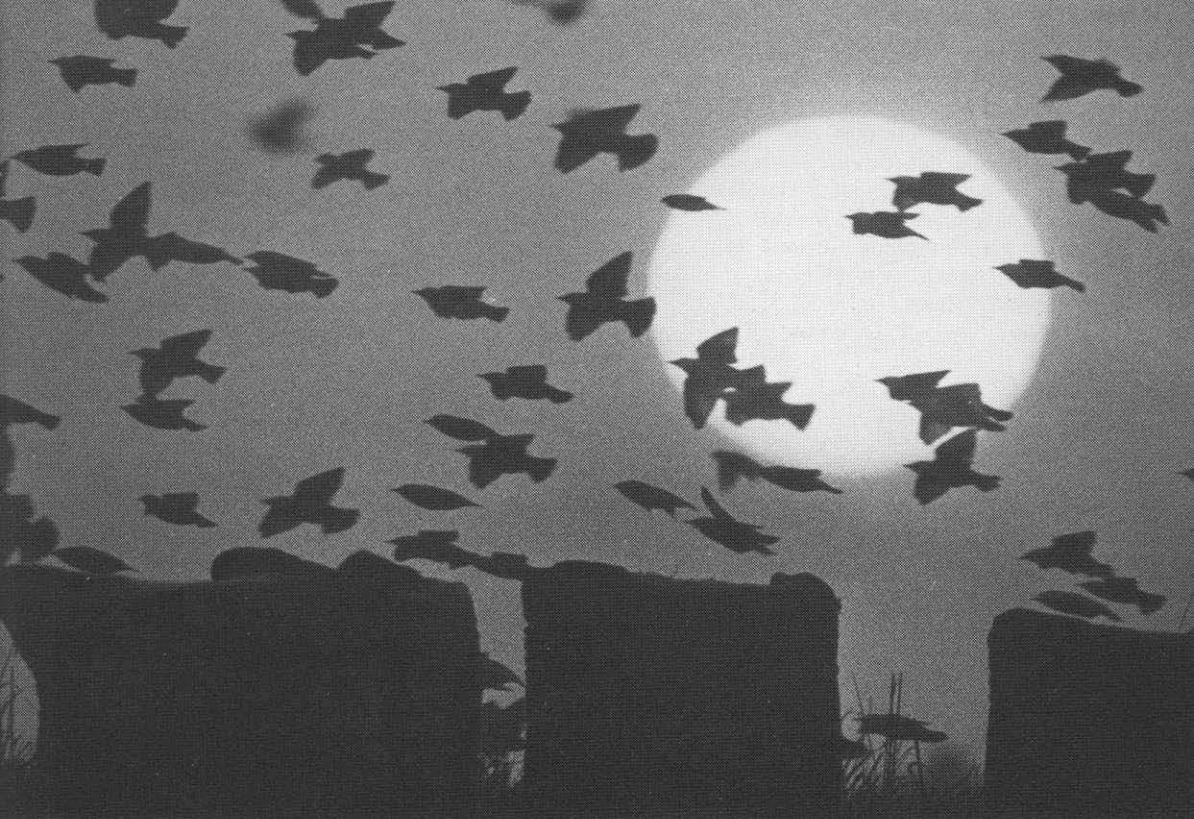
Stæreflok over høstmark i september.

(51) 262 34; (52) 69b 15; (53) 657d 34; (54) a 620d 24; b 620b 60; (55) 782 17; (56) 708f 17; (57) 433d 33; (58) 753q 35; (59) 124 19; (60) 67c 89f; (61) 113b 46; (62) 424b 49; (63) 615 30; (64) 249c upag.; (65) 5 37; (66) 48c 40f, 73f; (67) 56j 51f; (68) 56h 13; (69) 69d 7, 221; (70) 70 26-28, 70c 75-77; (71) 274c 33-36; (72) 280 105f; (73) 280b 50-52; (74) 333c 27-29; (75) 401o 87-89; (76) 404 11f; (77) 413g 55-57; (78) 424c 29; (79) 438d 100-05; (80) 470 1,10-13 sml. 3, 29-35; (81) 470 3,53-57; (82) 493e 7f; (83) 553 51; (84) 618 18; (85) 657b 44; (86) 696 97f; (87) 726b 37; (88) 744 37-40; (89) 753o 79-81; (90) 826 30; (91) 870c 50 sml. 81; (92) 875 13.