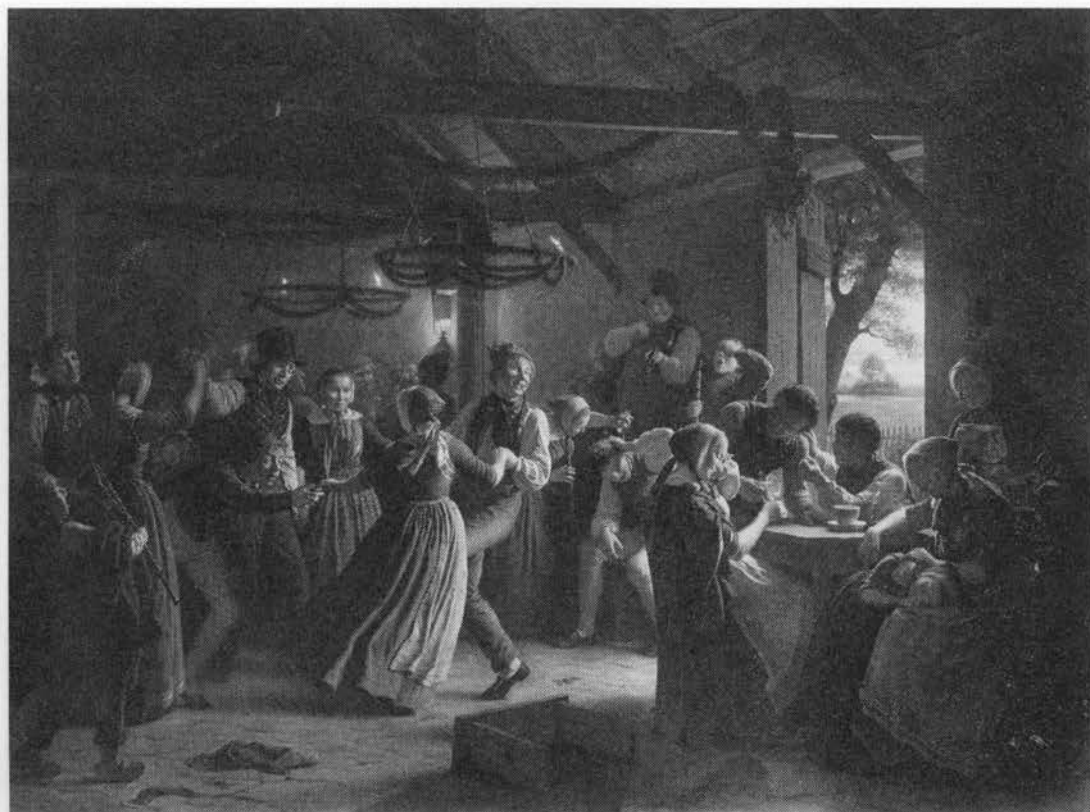
Man kaldte det at »drikke tidslerne ud af fingrene«, når bønderne efter bjærgningen af kornet afholdt det traditionelle høstgilde, hvor der ikke blev sparet på snapsen. Lystigheden vil ingen ende tage, selv om det efterhånden er ud på den lyse morgen. Maleri af Julius Exner. Overfor: Kåltidsel. (ES).

ve, der danner en stor top. Meget almindelig og frygtet ukrudt, tidligere navnlig i sædmarker. Skrubtidsl 1775, 1835, skrub er fællesnavn til store grove planter, piggetidsl Jylland o. 1880, fingertil Skanderborgegn o. 1880, gadelamsurt Øjylland o. 1850 – spøgefuldt eller ironisk: det var ikke netop sådan en blomst, karlen skulle give sit »gadelam« (pige tildelt ham ved fastelavnsildet); i høsten skulle han desuden sørge for – med smallere eller bredere skår – at pigen, som bandt op for ham, ikke blev stukket af tidsler i kornet (2) sml. s. 257; tyske roser VJylland o. 1850, gråtidsl Bornholm o. 1870ff, hantidsl . – Færøerne: akurtistil (3).