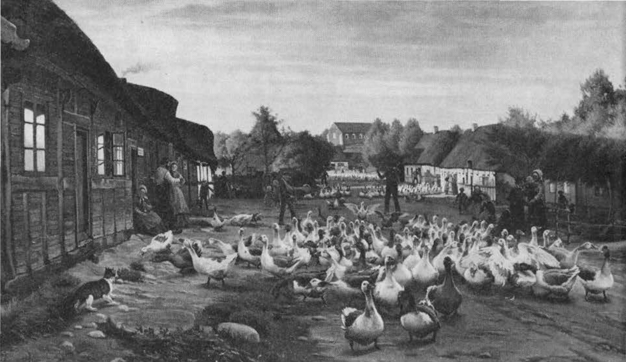
»Flokke af gæs drives gennem Ry«. Maleri af Hans Smidth, ca. 1879.

(12) 187 19; (13) 328f 1925,157; 865 196; (14) 107 1946; (15) 328f 2,136; (16) 328f 1,98; (17) 865 191f; 488 o 130; (18) 488 9,63; 488i 4,591; (19) 398 1806, 214; (20) 217 9; (21) 488 o 94; 903 270; (22) 418 175 (1868); (23) 902 56; (24) 488i 4,605; (25) 451b 84; (26) 752 94,100; (27) 193 1914,42; (28) 739 2,1800, 129ff; 83 125,166; (29) 83 111,290; (30) 515 1855, 287; (31) 57b 2,1806,710; (32) 83 66,68 (1700-t); 418 86; 328f 2,133f; (33) 83 58,62f,125,132,200f,287,307; (34) 936 1,1835,189f; (35) 83 202; (36) 57c 2,1810, 568; (37) 328f 1,35; (38) 194 2,475.