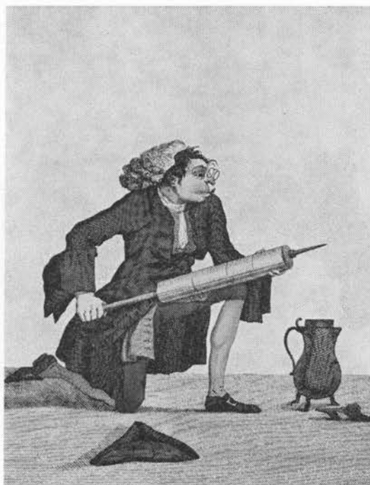
Karikatur af apoteker med klystersprøjte af G. C. Schule. Kobberstiksamlingen.

ske skader, som ikke er dybt indhugget«. Andre blander plantens saft med majmåneds smør til en sarsalve; denne skal først udsættes for solskin. Saften tørrer bylder og sår, fjerner dødt kød, læger skrammer.