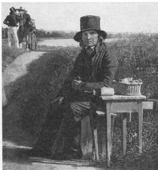
Cigarsælger på Kastelvolden. Maleri af Christen Købke.

LITTERATUR: (1) 830 9,94; 488n 135,274,289; (2) 586 2,1848,314; 488d 306; (3) 488d 315,344; (4) 488d 353f,620; (5) 690 24,76f; 984 283; (6) 488r 40; (7) 85 91f, 85b 73f, 85c 102f; (8) 665k.