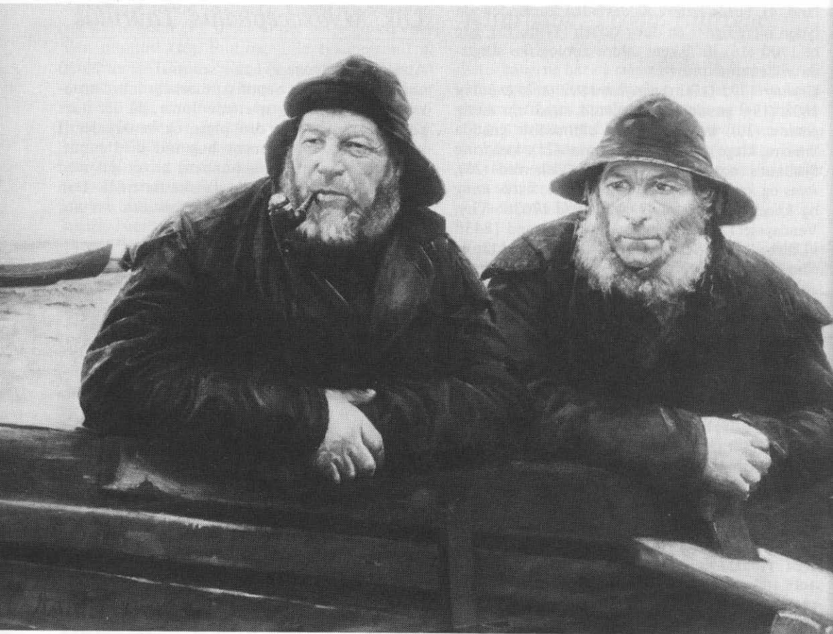
Ulakens barske og grove udseende skabte udtrykket en »søulk« om vejrbidte, barske skippere. Michael Ancher har på dette maleri fra 1889 indfanget typen med disse to stovte Skagenfiskere.

(13), nisse Odense fjord (16), lærkefisk Asnæs (13) er spættet som fuglen; skomager Gilleleje og lille ulk skrædder Humlebæk (13); tornet ulk: spidsulk Vendsyssel (17).