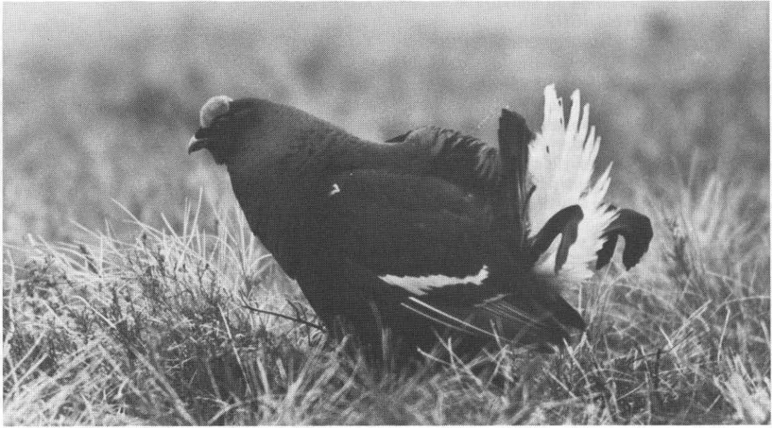
Skogrende urhane.

Vildtsmagen skal skyldes, at den æder mange revlinge-bær (4); man spiste den stegt, og de brogede halefjer pyntede en jægerhat (5).