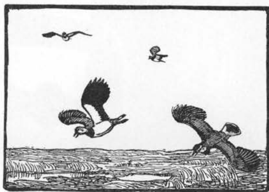
Viber. Træsnit af Johs. Larsen.