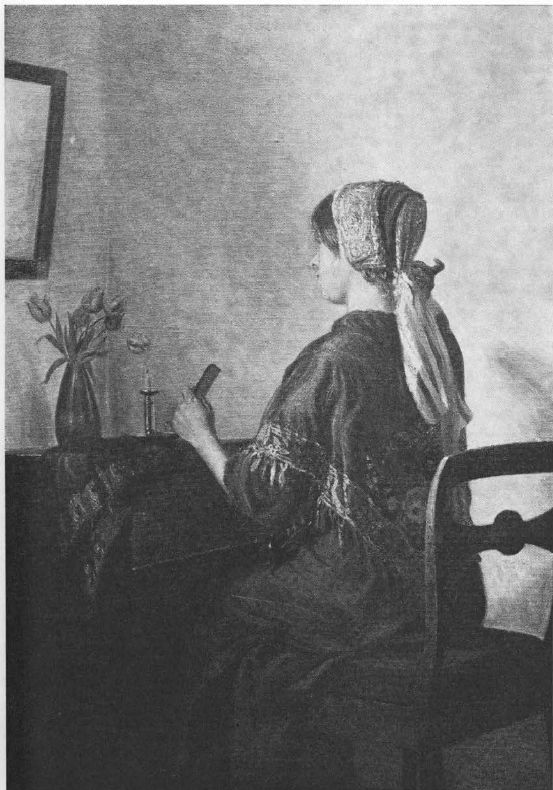
Vibefedt skulle give håret glans og farve. Maleri af Alfred Broge, 1916.