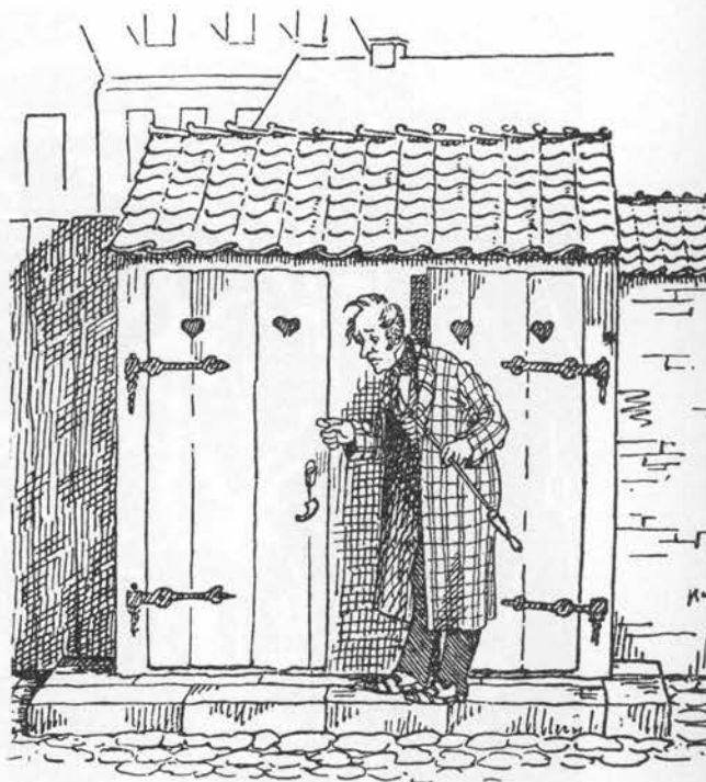
Vrietorn og tørstetræ indeholder stoffer med udpræget afførende virkning. Tegning af Fritz Jürgensen.

En sirup af bærrerne skal virke afførende og gives spædbørn, men det frarådes, da den kan