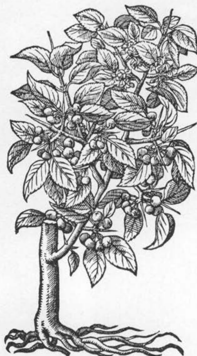
Vrietorn. Træsnit i Simon Paulli: Flora Danica , 1648.

Børn har trådet de smukke frugter på snor til »perlekæder«, »-kranse« (Sønderjylland, Fyn; 16).