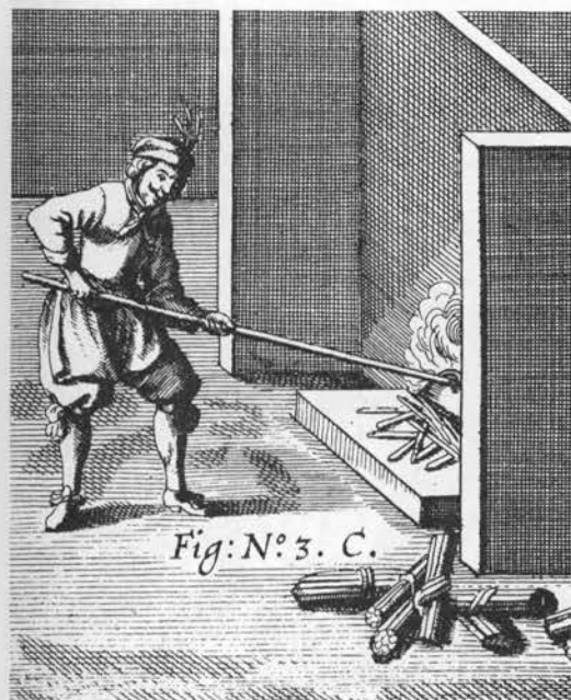
Fremstilling af trækul til brug ved krudtfabrikation. Kobberstik, 1676.

forårsage tarmsmerter. Modvirker også vattersot, men må anvendes med forsigtighed. Barken giver opkastning. Bladene skal være urindrivende og kunne stimulere køers mælkeydelse (1800; 2). Bærtsaften indgår nu i et afføringsmiddel (3). På Ærø er buskens bær eller bast anvendt mod mavesygdomme, vattersot og gift (4).