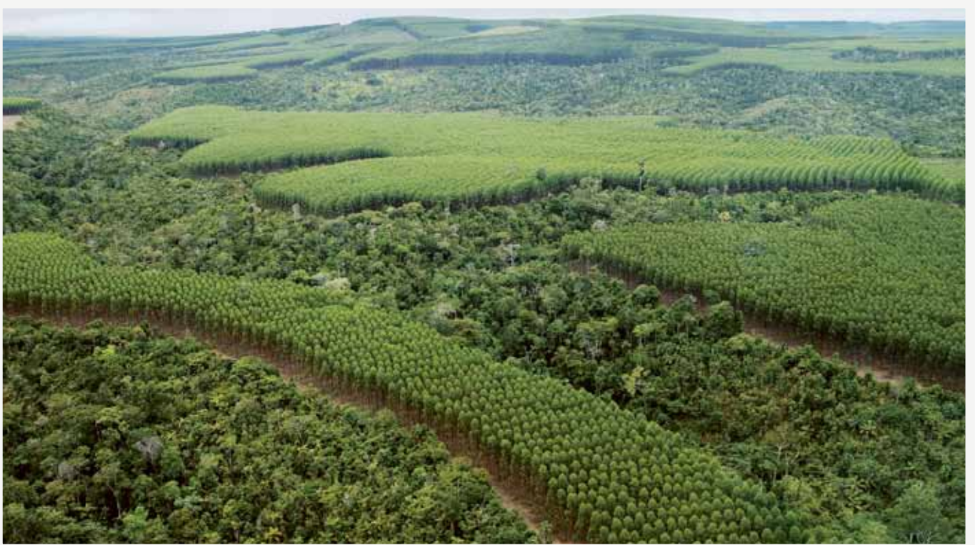
Exempel på landskapsplanering i Brasilien, med industriplanteringar och sammanhängande korridorer med naturskog.