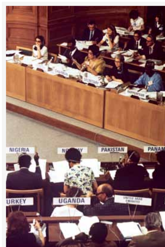
FN:s första miljökonferens i Stockholm 1972.

nella konventioner, men som är av ökande betydelse nationellt och regionalt. På många håll i världen, som t ex Sydafrika, Australien och Israel, finns det redan idag starka begränsningar gällande skogsodling där vattenförsörjningen anses hotad. Många av de stora vattenförvaltningarna, "River Basin Authorities", t ex runt Mekong, Nilen och Zambesifloderna, har rekommendationer om skogsanvändning i flodernas övre avrinningsområden. I vissa länder, som Costa Rica och länderna i Latinamerika, finns modeller för att ersätta skogsägare för miljötjänster, "environmental services", i form av bl a vattenproduktion.