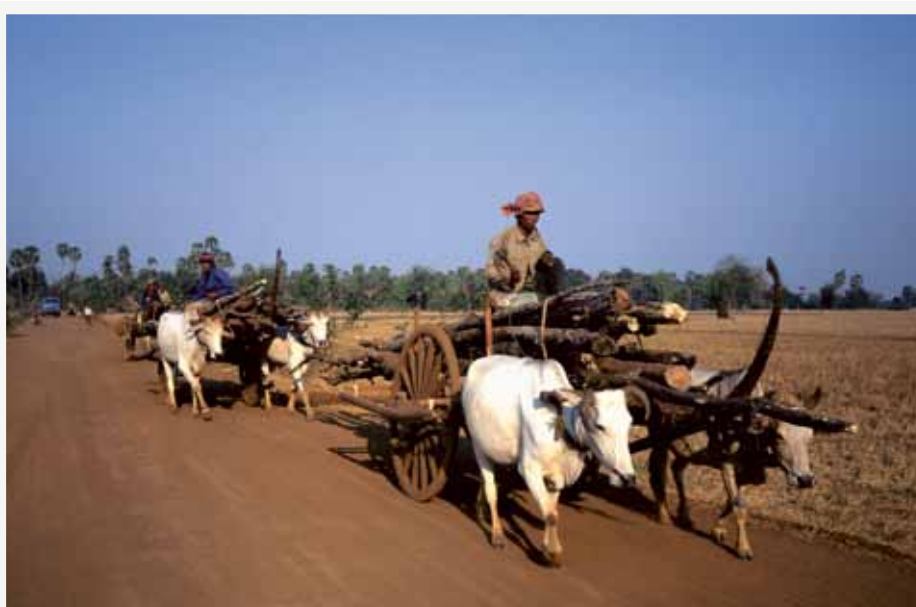
Ved är och förblir globalt sett en mycket viktig produkt.