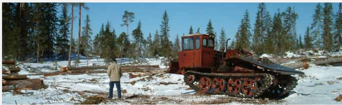
TDT55 tillverkas fortfarande i Petrozavodsk. Dags att lämna gamla metoder för avverkning och skötsel?

I Sverige skapar vi genom gallring slutavverkningsbestånd som är relativt jämna ifråga om trädslag, dimensioner och kvalitet. Vi tänker nog sällan på att en förutsättning för ett sådant skogsbruk är att det finns jämnt utspridda fabriker som efterfrågar gallringsvirket. Så är inte fallet i nordvästra Ryssland. I hela Arkhangelsk län (skogsareal 22,3 miljoner hektar) finns bara två områden med massaindustrier; Arkhangelsk i norr och Kotlas i sydöst. I Komi (skogsareal 30 miljoner hektar) finns