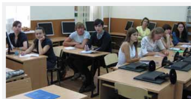
Den första gruppen av FORPEC-studenter i den nyrenoverade PC-lokalen.

Framtiden för samarbetet kan betraktas som ”lovande men skrämmande”. Det finns goda skäl att tro på ett fortsatt fruktbart samarbete. STA välkomnar svenska studenter att delta i kurser i S:t Petersburg eller att skriva examensarbete i Ryssland. För att det ska kunna realiseras krävs dock en ändrad attityd hos våra jägmästar-