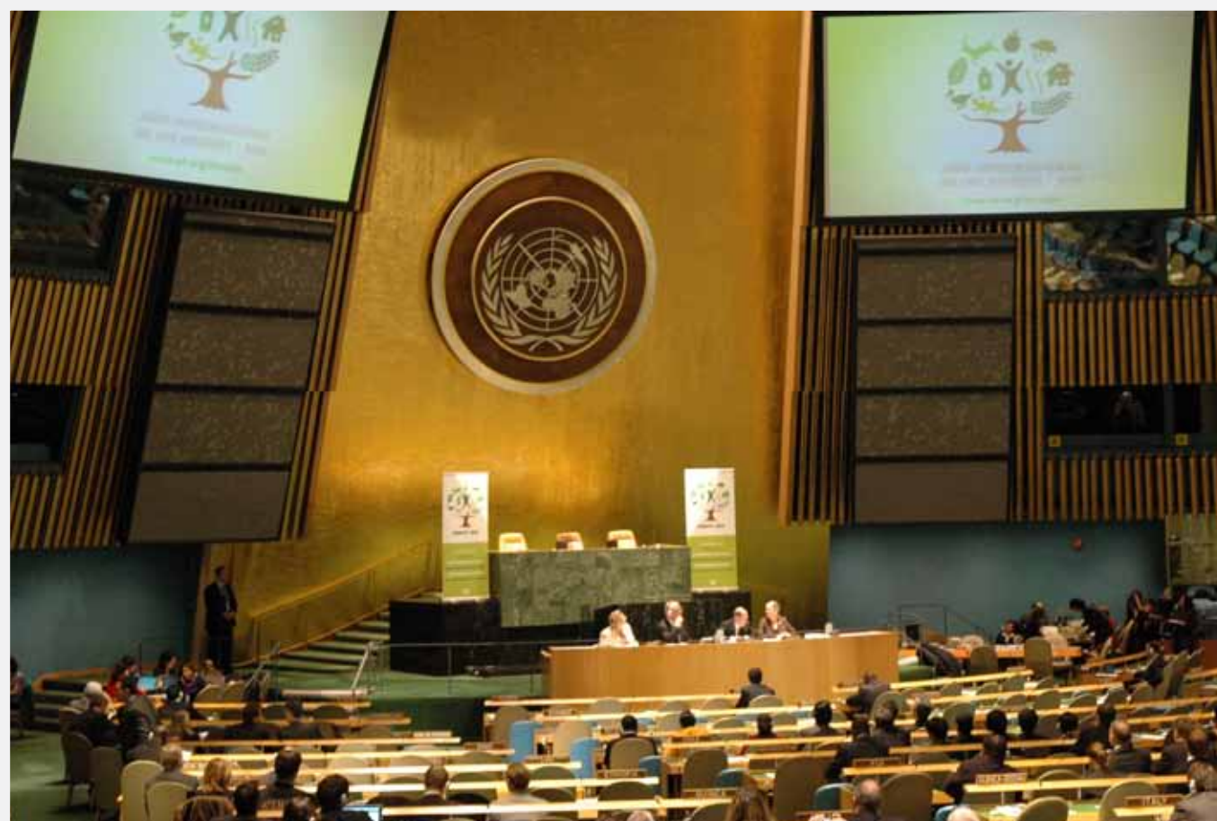
Lanseringen av det Internationella Skogsåret 2011 skedde under UNFF 9.