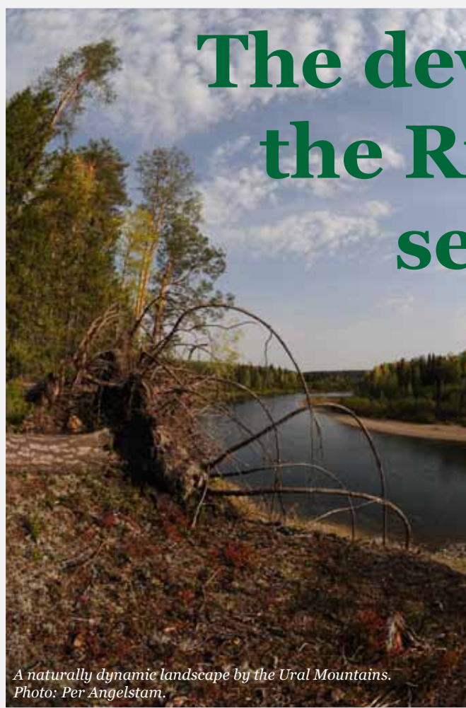
A naturally dynamic landscape by the Ural Mountains.

Main challenges for a successful development of the Russian forest sector are related to the availability of funding, to increased production of wood products with high added value, and to the present overuse of accessible forest.