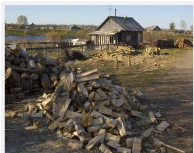
Aspen firewood in a village in Karelia.

TAKING INTO ACCOUNT the described situation, WWF in Russia is implementing a variety of activities to overcome existing problems in the area of illegal logging and trade elimination. In on-going projects, WWF is involved in intensive work on forest policy and legislation improvement, work on responsible business development ensuring legality of wood and wood products and promoting FSC certification in Russia, and on work on awareness raising, education and training. ○