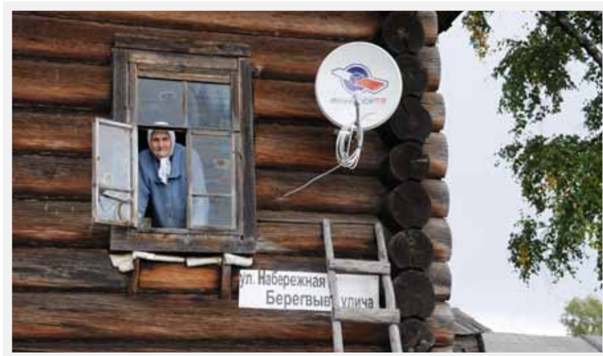
Landsbygden i Komi bebos av en äldre befolkning.

När trakthyggesbruk lanserades i stor skala i Norrland i och med 1948 års skogsvårdslag, kunde man förutse en framtida ålderssvacka. Därför lanserades en lång rad statliga åtgärder och bidrag gavs bland annat till plantering, vägbyggen, dikning och skogsplanläggning. Dessutom åtog sig skogsföretagen själva att avverka den mindre växtliga äldre skogen först och att ransonera den