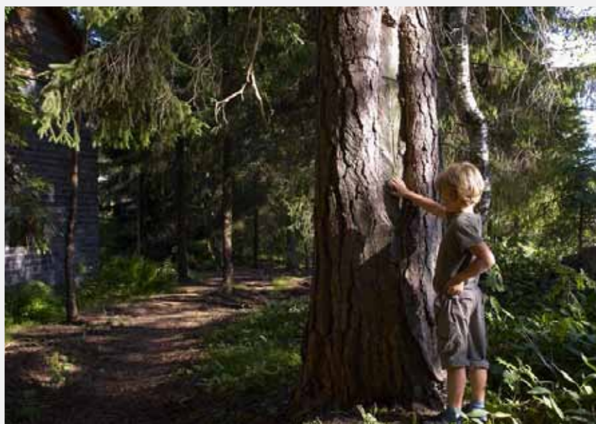
Resin collection has always been an important part of Russian forestry.

THE PLAN OF NEW LEGISLATIVE initiatives prepared by the Federal Forestry Agency includes a draft federal law on making changes in the Forest Code. The main task is to combat illegal logging and to preserve and to protect