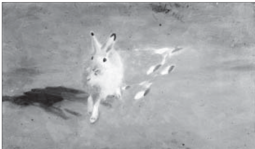
Bruno Liljefors, Skogshare på solbelyst fält (1910-talet). Bilden förenar naturalistisk illusion med en visionär skildring av ljuset över landskapet.

förhållande till livsmiljön när han en gång i faderns kruthandel kom att se några skjutna orrunga. Deras fjäderdräkt blev för honom ett koncentrat av fåglarnas livsmiljö, skogen med sina mossor och lavar, stämningar och färgsammanhang. Skildringen finns i memoarboken Det vildas rike (1934) och visar att han redan tidigt kom att leva i ett slags symbios med djuren i landskapet. Han insåg att djurbilden inte kunde ses som ett isolerat fenomen, helheten överflyglade detaljerna. Medlet att skildra de större sammanhangen gavs av kontakten med det nya friluftsmåleriet och snart även genom intresset för syntetismen och dess nya krav på tekniska lösningar. Längre var han också jägare och perspektivet i målningarna är inte sällan skyttens; men snart anonymiserades också det mänskliga inslaget. Han yttrade vid ett tillfälle att framtidens bössa var kameran. Paul Rosenius, Bengt Berg och andra hade då visat att naturfotografiet befann sig under fruktbar utveckling.