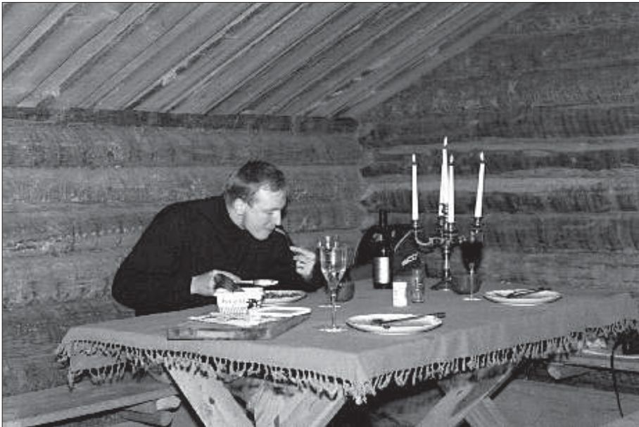
Finare middag serveras i Metervedkojan.

Den lokala ekonomin är en viktig del i detta. Att björnen drar besökare ger gynnsamma och intressanta synergieffekter, detta gynnar i slutändan bygden, djur- och naturskyddet. Vi arbetar med målsättning att eko-turistmärka produkten björnsafari. Dels kommer vi att ge kraftiga rabatter t.ex. för medlemmar i WWF, Naturskyddsföreningen etc. och på det sättet indirekt försöka sporra till flera medlemmar. Samtidigt som det lönar sig att gå in som medlem i WWF då man kan köpa den här björnsafarin till ett reducerat pris. Att studera björn från ett gömsle innebär att det blir ett visst slitage på naturen närmast gömslet. Detta kan endast minskas genom att begränsa antalet besökare i gömslet. Att begränsa antalet besökare är även viktigt för att behålla djurens naturliga skygghet. Naturligtvis skall även arbetet på kontoret inklusive all hantering av papper inriktas på återvinning och miljötänkande.