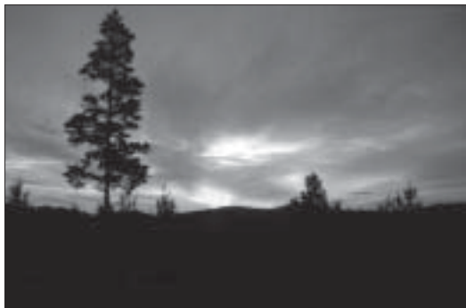
Gryning över tassemarker i Edsbyn, kan man skymta Gryningsbjörnen?

denna art som dagens krag- och svartbjörnar härrör. Den björn jag studerar och låter andra studera är den euroasiska brunbjörnen, Ursus arctos som under kvartärperioden för ca 40 000 år sedan trängde ned genom Europa och snabbt konkurrerade ut grottbjörnen, Ursus spelaeus från de vidsträckta björnmarkerna i Europa.