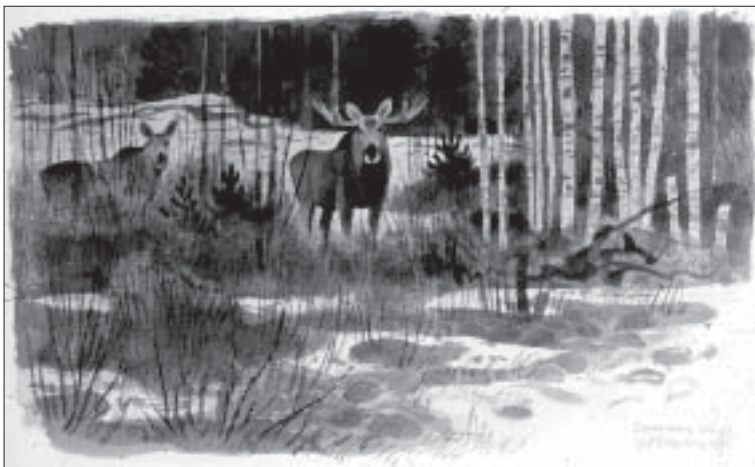
Gunnar Brusewitz, Älgar (1983). Bilden fångar ett ögonblick av förtätd uppmärksamhet, med djuren stående blickstilla bland sly och björkskog.

En central position intar Lars Jonsson. Bosatt på södra Gotland har han inmutat de gotländska strändernas fågelliv som sin speciella motivvärld. Jonsson arbetar främst med