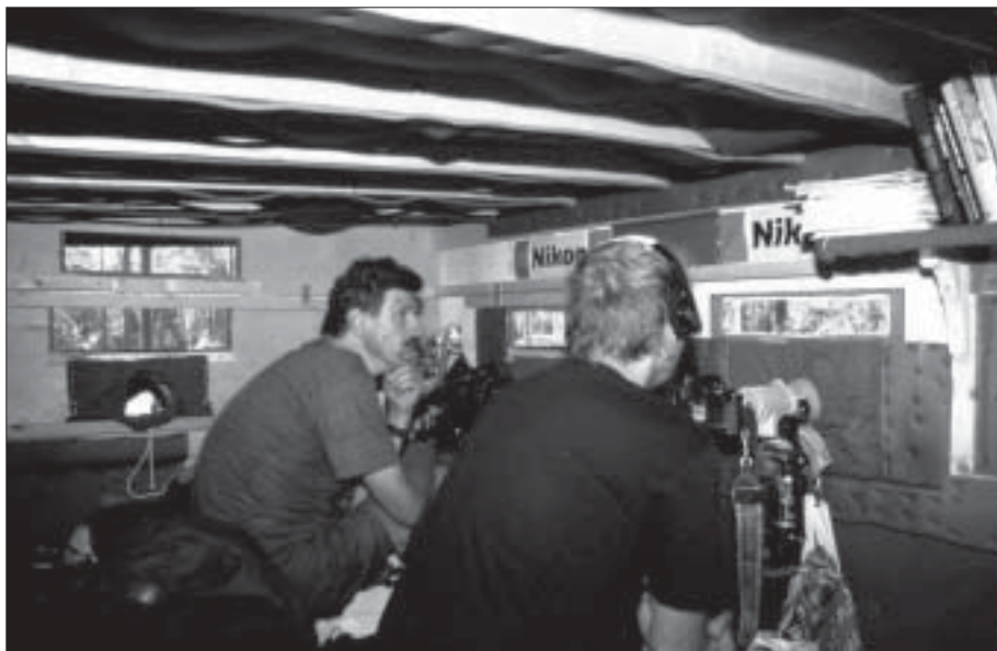
Professionellt gömsle, anpassat för den kräsne fotografens behov.

Att vi i år har sett björn i något färre fall beror på att vi har haft problem med storm-