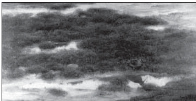
Bruno Liljefors, Beckasin (1905). Vadarfågeln ute i våtmarkerna är knappt synlig men avslöjas genom speglingen i vattnet, tilltäckligt för att locka tänkbara predatorer. Utsattheten kan tolkas i darwinistiska termer men erinrar också om den personliga dimensionen i Liljefors konst.

Kontakten med Liljefors finns också hos Gunnar Brusewitz som med skarpögd obser-