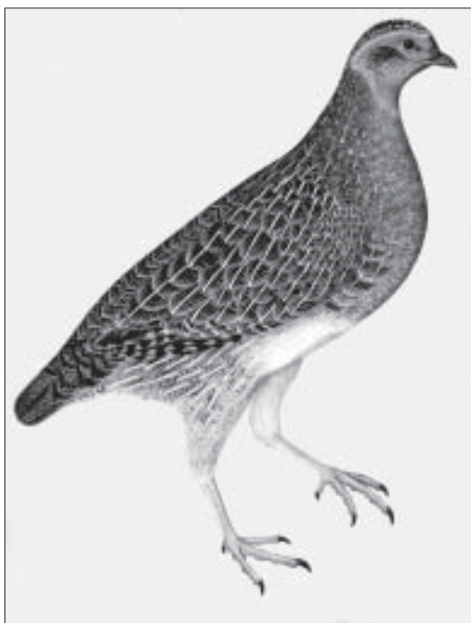
O. Rudbeck d.y., Raphöna, ur Fogelboken (omkr. 1700). Exempel på långtgående illusion med utnyttjande av akvarelltekniken. Genom skalan 1:1 förstärks intrycket av närgånget studium av anatomi och fjäderskrud.

Mot slutet av 1600-talet utförde Olof Rudbeck d.y. sin berömda fågelbok där han med sina akvareller i naturlig storlek åstadkom en pionjärbedrift inom den svenska ornitologin. En virtuost avbildad raphöna erinrar om förutsättningarna för denna typ av konst – i grunden fanns det naturalhistoriska intresset, övertaget från den tradition som startat under den italienska renässansen, därtill kom jakten som nödvändig förutsättning för detaljstudiet av djuren liksom slutligen den patriotiska mentalitet som bar upp hela projektet, med garanterat stöd och uppmuntran från högsta ort. Rudbecks raphöna hade sina