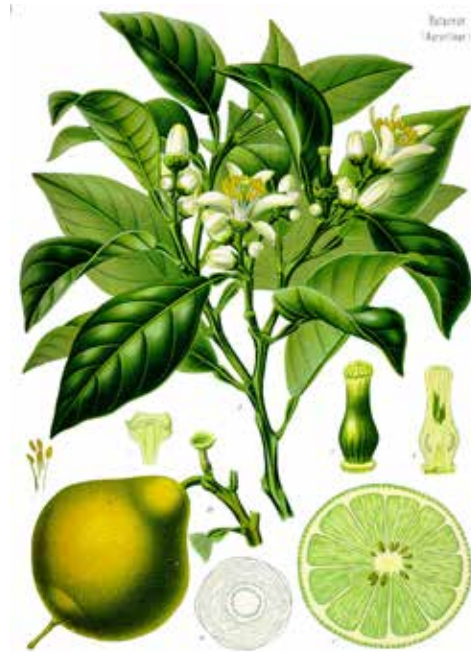
Bergamott (Citrus aurantiifolia), ur Franz Euguen Köhler's Medizinal-Pflanzen in naturgetreuben Abbildungen mit kurz erläuterendem Texte, 1883–1914.