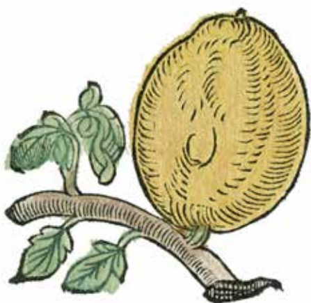
Citron (Citrus limonia), ur Christian Egenolff, Herbarum, arbum, fruticum, frumentorum ac leguminem, Frankfurt, 1546.

(Spanien); 7 saften indtages på Sicilien mod lungesvindst og sidesmerter. 8 Hos de mellemamerikanske Maya-indianere bruges bark af Plumeria alba kogt i appelsin- eller citronsaft for hoste, astma og kighoste; appelsinsaft og ristet salt indtages mod hvid belægning i svelget. 9 Citronsaft drikkes for blodspytning (Maya, Indonesien). 10 Mange patienter med astma fik det bedre, når de før hvert måltid og om aftenen tog en halv spiseskefuld citronsaft; russisk folkemedicin anvender revet peberrod i saften af 2–3 citroner, ½ teskefuld heraf to gange dagligt. 11 – For trøske gnides tandkødet eller skylles munden med saften af citron, pomerans eller bergamot-orange (Friesland, Trinidad). 12