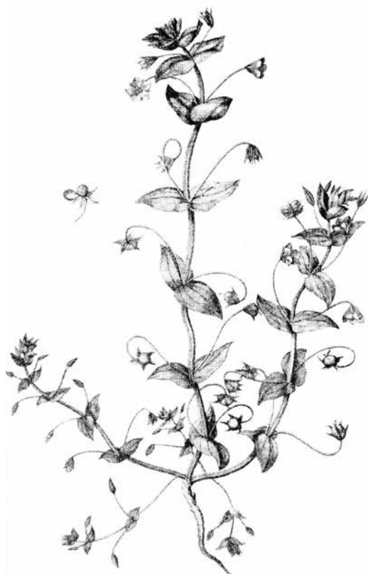
Rød Arve ( Anagallis arvensis ). Kobberstikket i Theodor Holms Afhandling 1761)

1720 nævnes den af Johannes de Buchwald i Specimen Medico-Practico-Botanicum .