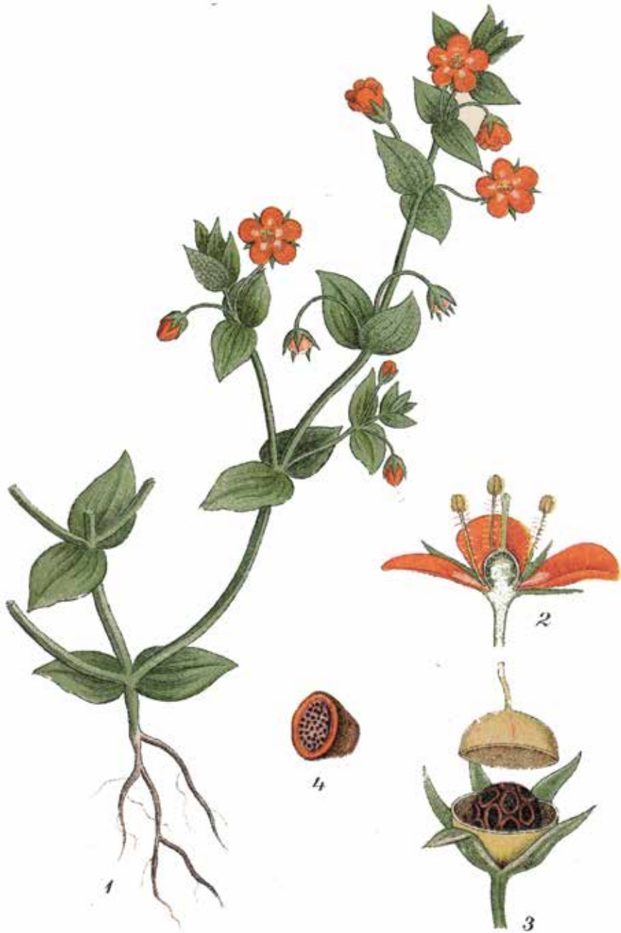
Rödmire eller rödarv ( Anagallis arvensis ), ur C.A.M. Lindmans Nordens flora , 1917.