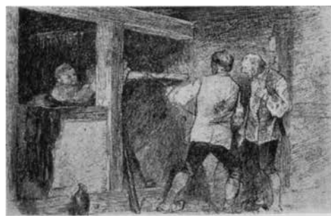
Nødild. (Illustreret Tidende 1886).

En norsk Forfatter fra 1500-Tallet oplyser, at mange Køer, Heste og andre Husdyr blev bidt af gale Ulve og døde. Bønderne kendte ikke andet forebyggende "Middel" end at gøre Nødild , d.v.s. frembringe Ild ved Gnidning, og lade Røgen derfra gaa henover Køerne. 9 Andre lod en "Bustein" (et Konkrement af Haar og ufordøjelige Foderrester i Drøvtyggerses og Hestes Tarmkanal) ligge i rabiessyge Køers Drikkevand. 10