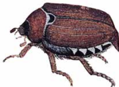
Ollonborre (Melolontha melolontha). Olof Rudbeck d.y., 1693–1710

Af Midler, der bragtes i Anvendelse, naar et Dyr eller Menneske var blevet bidt og smittet, kan nævnes: Oldenborrer fanget i Maj Maaned og druknet i Honning; de indgaves hele, eller "Saften" blev presset af Insekterne. Dette er et berømt Middel mod Vandskræk, naar det bruges straks, før Vandskrækken indfinder