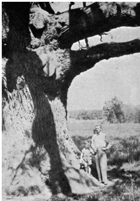
Ambrosiusegen, Foto; 1965.

Den 60-stammede eller 60-armede Bøg i Kræmmerskoven, Bøjden-Nyborg vejen ved Brahetrolleborg, i sin tid (1910) kaldt Den 53-stammede Bøg . Fredet 1925; 1955 var der kun 16–18 stammer tilbage, og de blev vindfældet 1962. 49