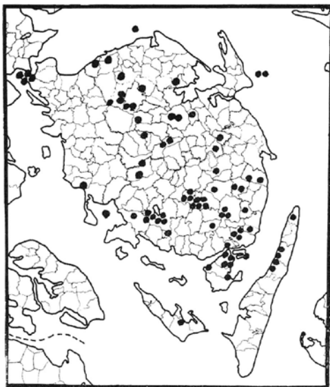
Navngivne træer på Fyn.

Tidligere malere på Fyn såsom C. F. Aagaard og Dankvart Dreyer havde deres meget personlige omgang med popler. For sidstnævntes vedkommende fremgår det bl.a. af Fyns Stifts Kunstmuseums Udsigt fra Assens mod den sønderjyske kyst . Senere malede Brendekilde og vennen L. A. Ring pil og poppel på deres måde ... Sybergs omgang med popler kender enhver, der overhovedet kender malerkunst på Fyn. For ham var poplen