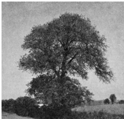
Elm ved Egelund, Rask-slægtens værnetræ.

En gammel elm værnede Vandmøllegården i Turup. Man sagde, den var plantet ”over ild”, og led træet overlast, skulle gården brænde. Sommeren 1926 ramtes det af et lyn og blev