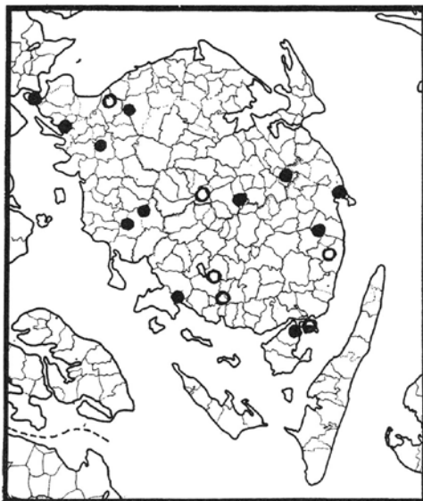
Omstående kort viser grundlovsege (fyldte) og andre mindetræer (ofyldte) på Fyn.

rejst i rad langs agerskel og hegn tegnr popler, alvorstungt som pinier, egnens træk i strenge, sorte linjer.