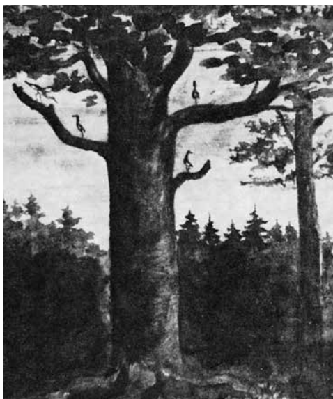
Trindholmbøgen, Stepping, måtte ikke fældes, da Anderupgård så ville brænde. Den faldt i et stormvejr ca. 1915 og fik da lov at ligge urørt i skogen. Malet da et storketræk havde sat sig til hvile i bøgens top. Trap Danmark. (Dansk Folkemindesamling).