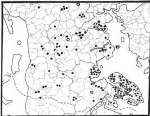
Så tæt står eller stod landsdelens ● brandtræer, x ulykkes- og vænetræer samt o hultræerne.