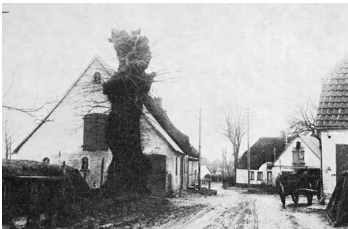
Brandtræ ved bygaden i Dyngved, Egen, Peter Christiansen, Dyngved: Når træet i forgrunden bliver fældet brænder gaden. Gengivet: H. Ussing »Det gamle Als«, 1926. (Dansk Folkemindesamling).

træet og hun ville dø samtidig. Den dag træet faldt, døde hun ved et slagtilfælde, godt 90 år gammel. 92