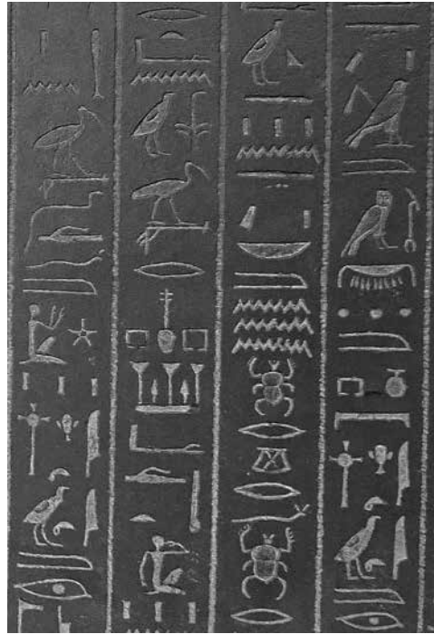
Biologisk mångfald i egyptisk tappning på sarkofagen till Ankhnesneferibre (c:a 500 f.Kr.) på British Museum.

En viktig bevekelsegrund för denna typ av studier har varit att särskilt lyfta fram det ekonomiska värdet av naturbruket och det är också anledningen till framväxten av forskningsområdet ekonomisk botanik. Detta ämne representeras bl.a. av ett internationellt forskarsällskap International Society for Economic Botany och beskrivs som: