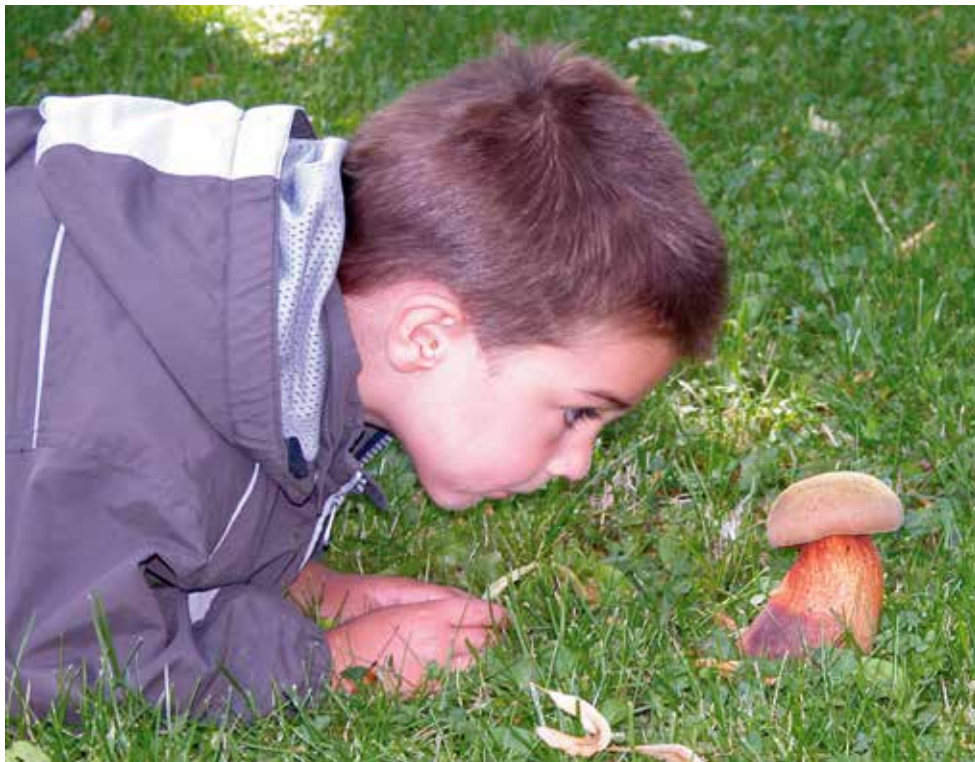
Nyfikenhet på naturen. En iögonfallande eldsopp (Boletus luridus) väcker ett spontant intresse.

kunnande genom att försöka kartlägga andra kulturernas nyttjande, dvs. det som i akademiska sammanhang kallas etnobiologi. Det finns visserligen en mängd olika personer som långt tidigare började lista användningen av växter och djur, men jag väljer att inleda resonemanget med vår egen blomsterkung Carl von Linné (1707–1778). Anledningen till detta är hans rika skriftproduktion vad gäller naturens nyttjande, både i form av listningar och reseskildringar i olika sammanhang. Hans resande till olika landsändor av Sverige, som inleddes med Lapplandsresan 1732, hade flera syften: