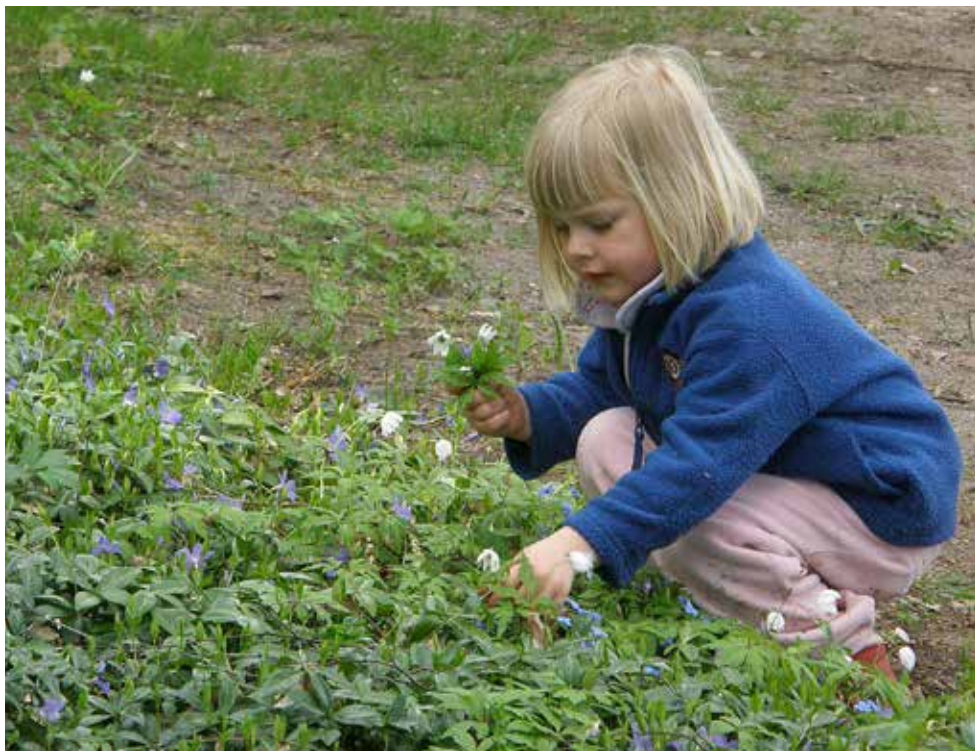
Vårt förhållande till naturen är mycket komplext och genom leken grundas tidigt mycket av vår syn på naturens detaljer, vilket även påverkar oss långt senare.

handlar främst om tidskrifter inom humaniora, t.ex. de danska Danske folkemål , Danske studier och Sprog og kultur , de svenska Arv och Svenska landsmål och svenskt folkliv , men han publicerade också humanistiska alster i mer naturvetenskapligt inriktade tidskrifter, såsom de tyska Naturwissenschaftliche Rundschau och Pharmazeutische Zeitung samt den vetenskapshistoriska tidskriften Sudhoffs Archiv . I Danmark återfinns bidrag även i Dansk Pædagogisk Tidsskrift och Ugeskrift for læger , i Sverige återfinns också bidrag i Svensk Farmaceutisk Tidsskrift och Linnésällskapets årskrift och i Norge publicerade Brøndegaard i Blyttia – Tidsskrift for Norsk Botanisk Forening . Utöver mer generella etnobiologiska essäer kan man dela in dessa artiklar på följande huvudteman: