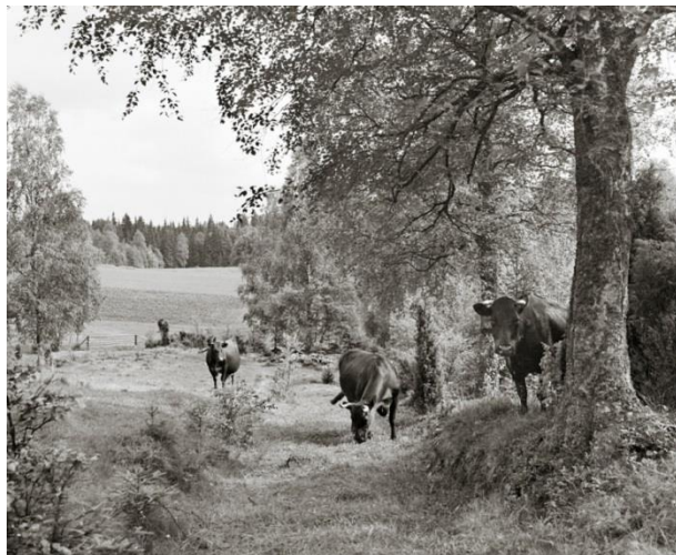
Vråna Alingås 1983 2012