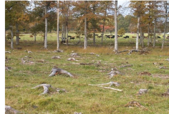
Björkhage + fd skog + marginell åker