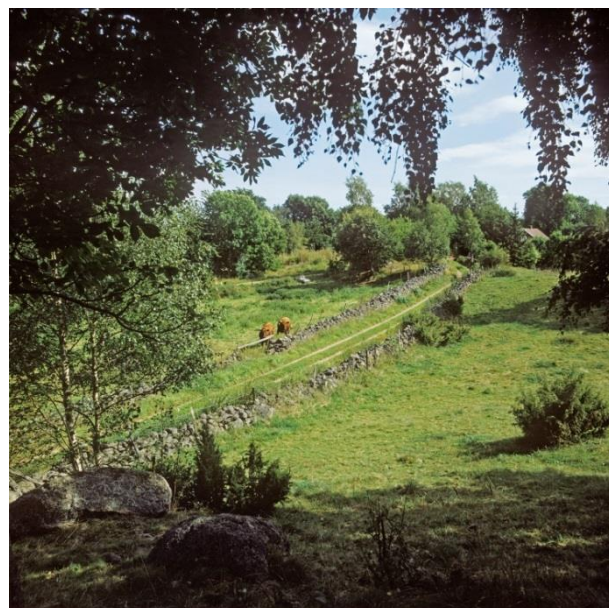
Skår i Gökhem 1984 2012