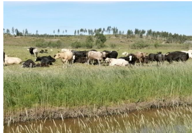
Våtmarksbete + fd skog