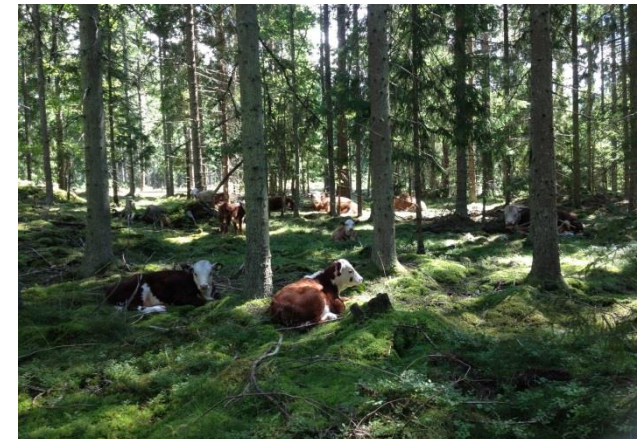
Skogsbete binder samman spridda betesmarker