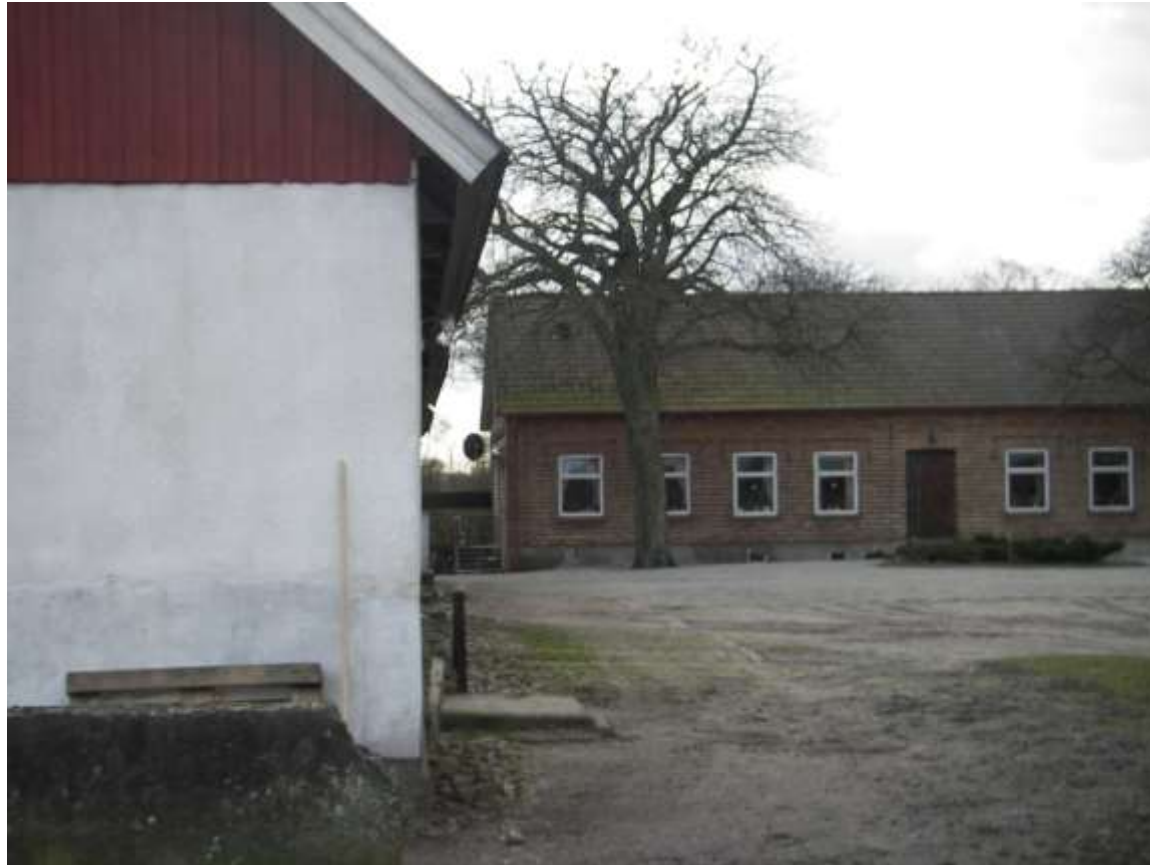
Granelunds gård, Flyinge